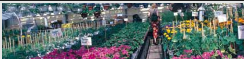
Säkrare hantering av bekämpningsmedel och slutna bevattningssystem kan minimera läckaget.