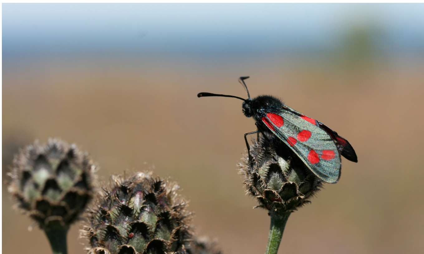
Sextfläckig bastardsvärmare.

av er har varit med och bidragit med bilder och andra har hjälpt till med att granska texter. Under vintern kommer vi jobba hårt med att få klart resten. Om ni har bilder som ni gärna delar med er av i detta syfte så är det bara att höra av sig.