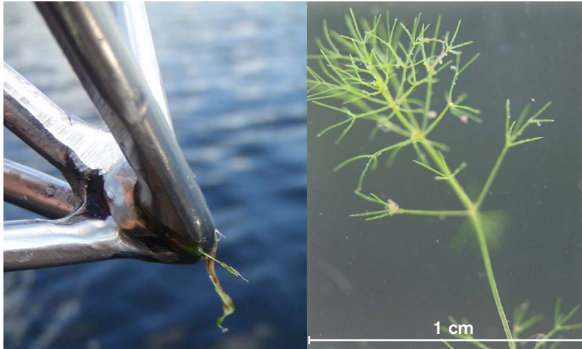
Metallens diameter på kroken är 5 mm.