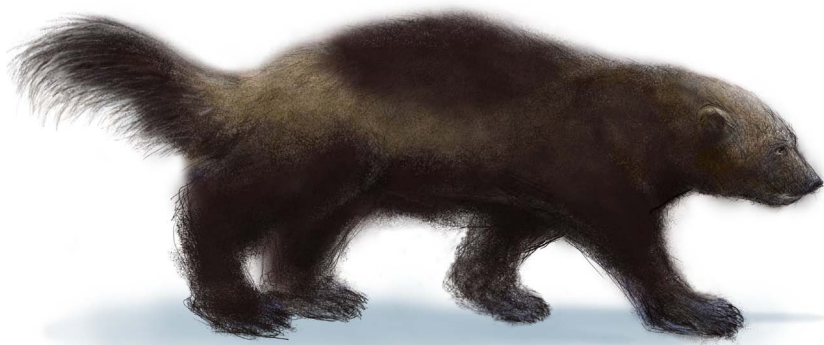
Illustration: Torbjörn Östman