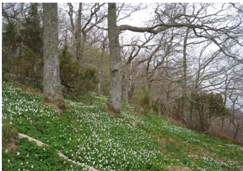
Ekskog av lågörttyp på Stenshuvud, Skåne. Den ljuskrävande enbusken minskar i Sveriges skogar medan vitsippans förekomst har varit stabil under de senaste 20 åren.