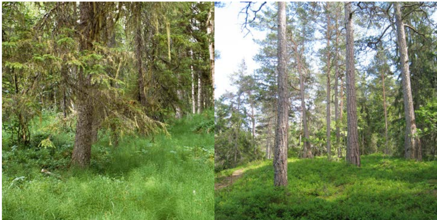
Granskog på torvmark med fältskikt dominerat av fräken, Ramsele, Ångermanland (t.v.). Tallskog på moränmark med fältskikt dominerat av blåbär, Tyresö, Södermanland (t.h.).