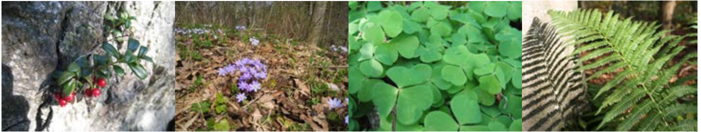
Figur 3. Lingon är en av flera risväxter som minskar i frekvens i södra Sverige. Blåsippa minskar i södra Sverige men ökar i norr, och är därmed en av mycket få arter med motsatta trender i de två landsdelarna. Harsyra är en av flera skuggtåliga arter som ökar i hela landet. Träjon är en av flera ombunkar som har ökat i frekvens under de senaste tjugo åren.

Framtida uppföljningar kommer att visa om effekterna av de globala miljöförändringarna och av ett ändrat skogsbruk som vi ser i södra Sverige så småningom även påverkar norra Sveriges skogsvegetation i större omfattning. Särskilt om en ökad till-