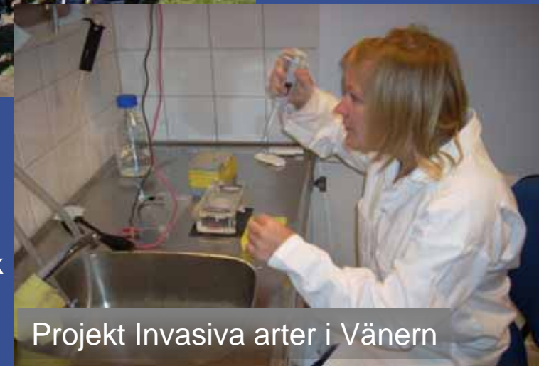
Projekt Invasiva arter i Vänern