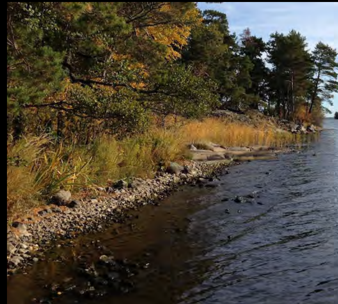
Stenig strandremsa på sjöns västra sida.

På ett ställe norr om badplatsen är både strandremsa och botten mer stenig. Man kan lätt gå ut i vattnet även här.