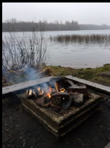
Bad- och grillplats vid sjöns västra sida.