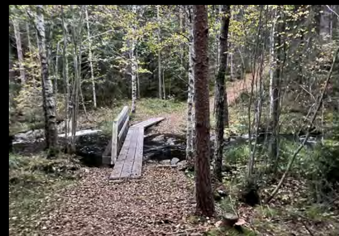
Spång över bäcken till östra sidan av sjön