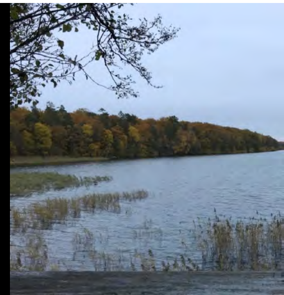
Utsikt från fågeltornet

Vid badplatsen finns ett utedass och en enkel grillplats. Det är långgrund och lätt att komma ut i vattnet. Det är främst sandbotten. Badplatsen och grillplatsen används framförallt av närboende. I sjön lever bland annat abborre, gädda, häger och bäver.