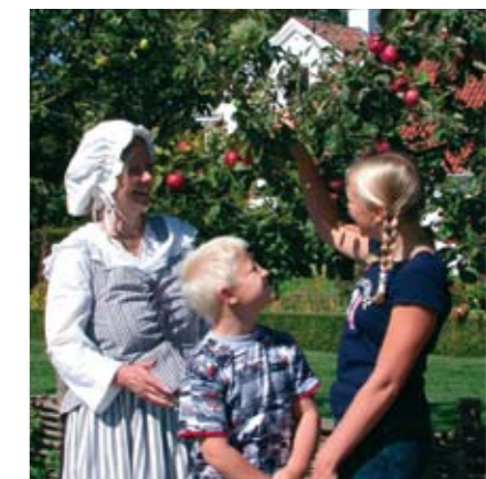
Fredriksdals fruktträdgård – en given attraktion för alla, stora som små.