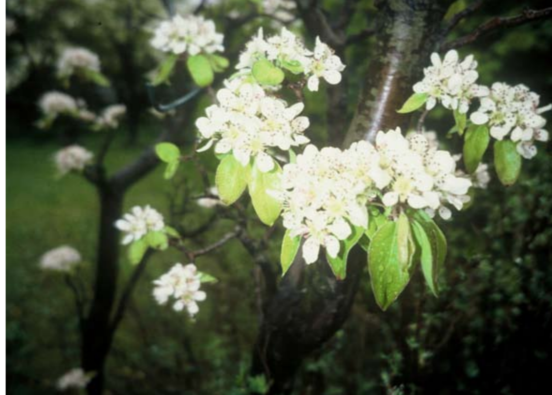
Blommande päron av sorten Pierre Corneille, en fransk sort från tiden kring sekelskiftet 1800/1900.

Capellagården. Vickleby, 386 93 Färjestaden