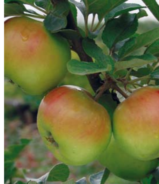
Flädie är en känd lokal skånsk äppelsort från byn Flädie utanför Lund, där den antas ha uppstått ur en kärna av Gravensteiner. Flädie är ett saftigt höstäpple med något syrlig svag arom.

Gisela trapps väg 1, 254 37 Helsingborg. Info tel 042-104500 eller fredriksdal@helsingborg.se , bokning öppet året runt tel 042-104505.