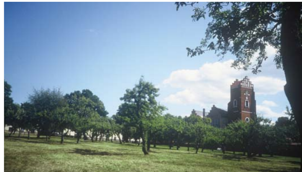
Klonarkivet ingår i Vadstenas historiska miljö. Bland de äldsta träden märks ett ståtligt exemplar av Munkpäron, en sort som anses ha anor från det medeltida klosterområdet.

Pomerium Vadstenense tillhör det medeltida klosterområdet intill klosterkyrkan.