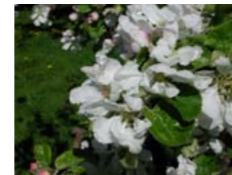
Äppelblom av Kavlás, en lokalsort från Västergötland, som fått sitt namn efter gården där den blev funnen på 1820-talet.