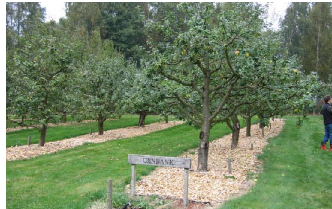
I Munkagårdsgymnasiets genbank har frukt-sorter från Västsverige funnit en fristad.