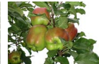
Lokalsorten Gunilla Bohuslän känns igen på sina karaktäristiska, stora och långsträckta frukter.