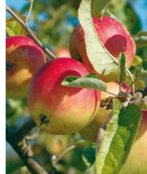
Tornpipping är en lokal äppelsort som pomologen Olof Eneroth fann i Skåne, bland annat vid Tosterup i sydöstra Skåne. Tornpipping är ett vinteräpple, med god smak men med något torrt fruktkött.