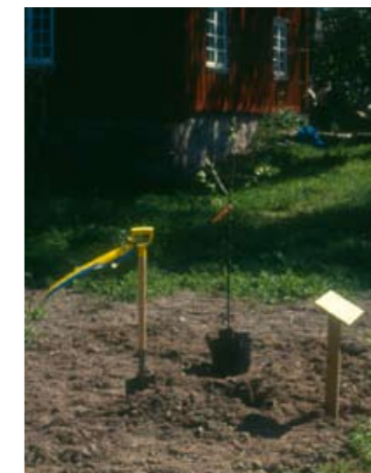
Våren 1993 planterades de första träden i von Echstedtska gårdens klonarkiv högtidligen i närvaro av bl a landshövdingen i Värmland.