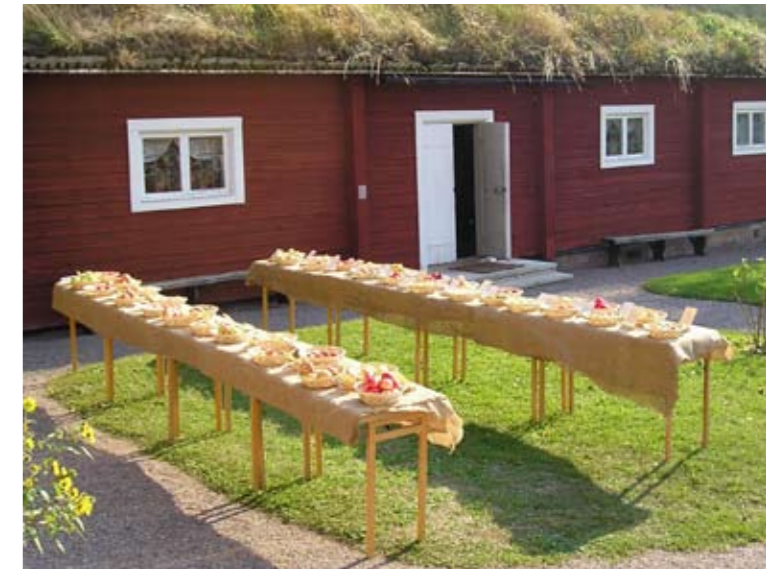
Traditionen bjuder att det är fruktutställning på Linnés Hammarby i september.