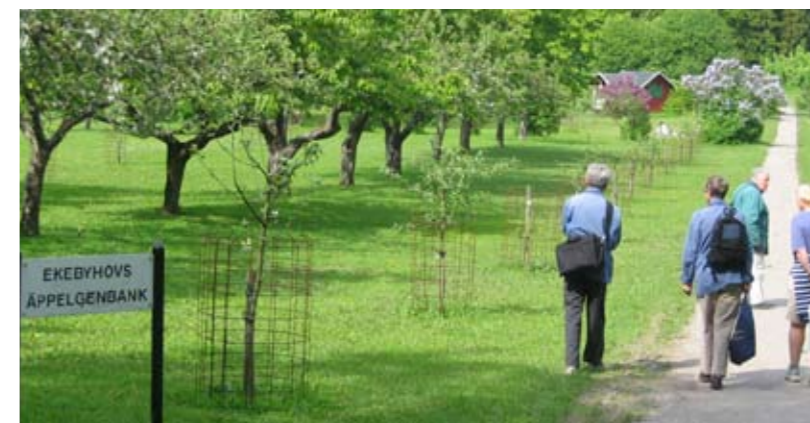
Flertalet sorter i Ekebyhofs äppelgenbank har anknytning till Uppland och Mellansverige.