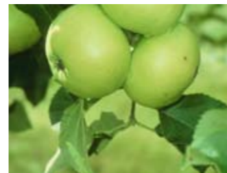
Granatäpple är en välkänd halländsk lokalsort med månghundraårig odlingstradition. I Skåne har den gått under namnet Hellerups klarett.