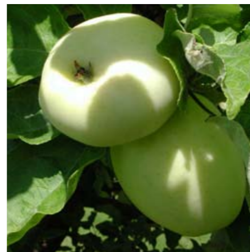
Transparente blanche mognar i augusti. Äldre träd av sorten är fortfarande vanliga i hemträdgårdarna. Idag finns modernare tidigmognande sorter att tillgå.