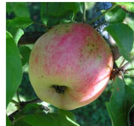
På Linnés tid torde druväpple ha varit en vanlig benämning på vissa småfruktiga äppelsorter. Den sort som vi idag kallar Druväpple kommer från Fullerö säteri i Västmanland.