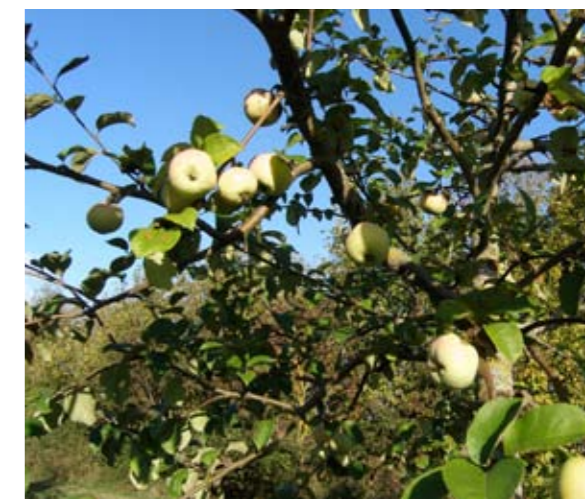
Bläsingsäpple är en sort varav gamla träd fanns vid Bläsinge gård i Västkinde socken nära Visby redan på 1920-talet.