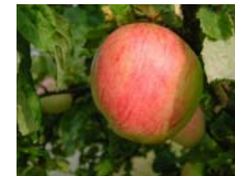
Frukten hos Kavlás mognar i oktober. Äpplet är stort, saftigt och välsmakande.