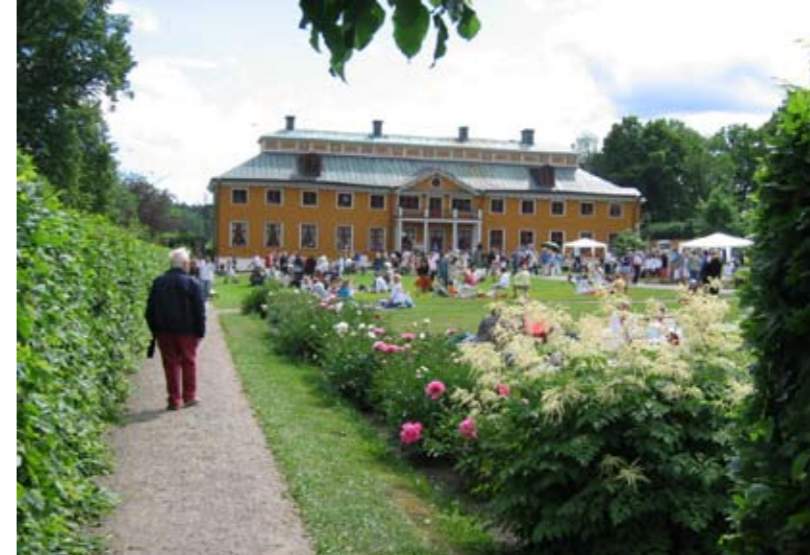
Den vackra gula huvudbyggnaden, som i dagligt tal kallas Ekebyhofs slott, uppfördes på 1670-talet. Under veckosluten bjuder slottets Intresseförening in till kulturevenemang och kafé.