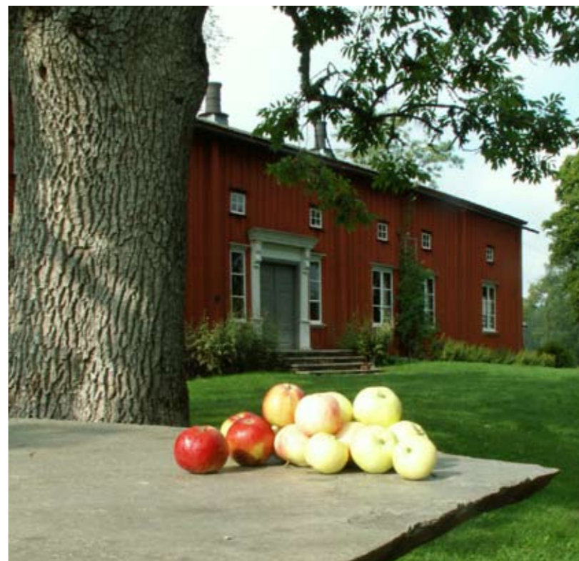
von Echstedtska gården byggdes mellan 1762 och 1764. Utsidan har en nästan karolinsk prägel, medan inredningen går i rokokostil.