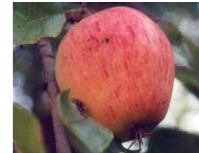
Värmlands paradisäpple är en av de äldsta Värmlandssorterna. Ursprunget är okänt men det anses att sorten var vanlig i odling redan i början av 1800-talet.