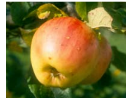
Odensta är en äppelsort funnen vid Odensta gård i Värmlands Nysäter. Den har inte kunnat identifieras med någon känd sort och räknas därför till de värmländska lokalsorterna.