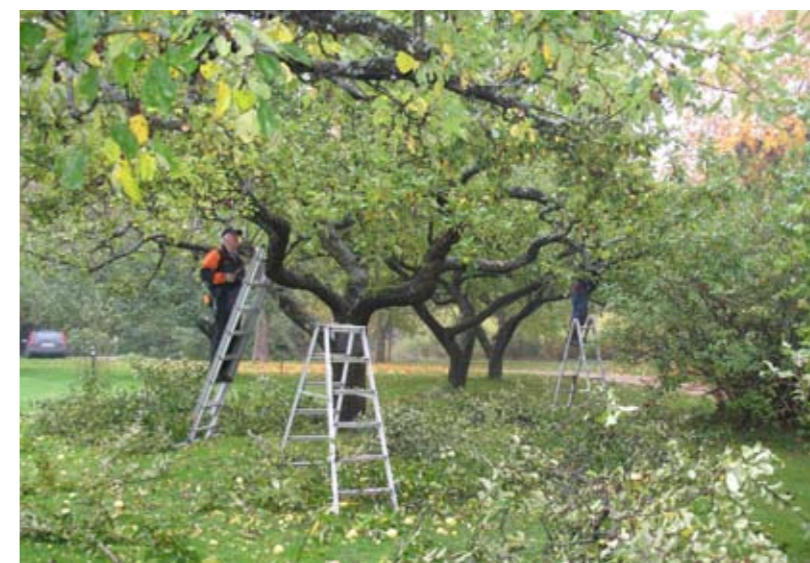
På Ekebyhov är allmänheten välkommen att följa beskärningsarbetet som utförs av medlemmar i Sveriges Pomologiska Sällskap.