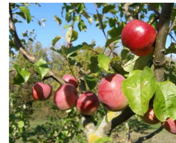
Kamsäpple är annan gotländsk lokalsort funnen i Halla socken på mellersta Gotland.