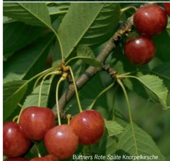
Büttners Rote Späte Knorpelkirsche