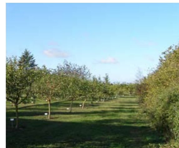
Fältet där fruktträden odlas är omgivet av skyddande häckar.