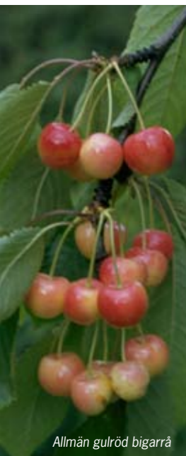
Allmän gulröd bigarrå