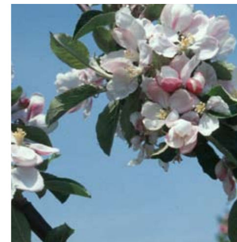
Gravensteiner har fått sitt namn efter slottet Gråsten på Sydjylland. Sorten har odlats i Norden sedan 1700-talet. Blommorna är vita, stora och bredbladiga.

Äpplet Sankta Brita är uppkallat efter den Heliga Birgitta. Frukten är saftig och har utsökt arom.