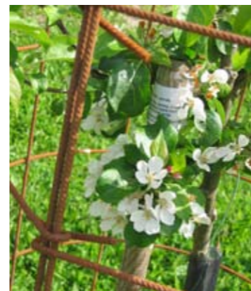
Träden i klonarkivet är försedda med etiketter som berättar äppelso- ternas historia.

Ekebyhov ligger på Ekerö i Mälaren. Buss- och vägförbindelserna från Brommaplan är goda. Det tar ca 15 min. att promenera från hpl Ekerö Centrum eller Ekebyhov.