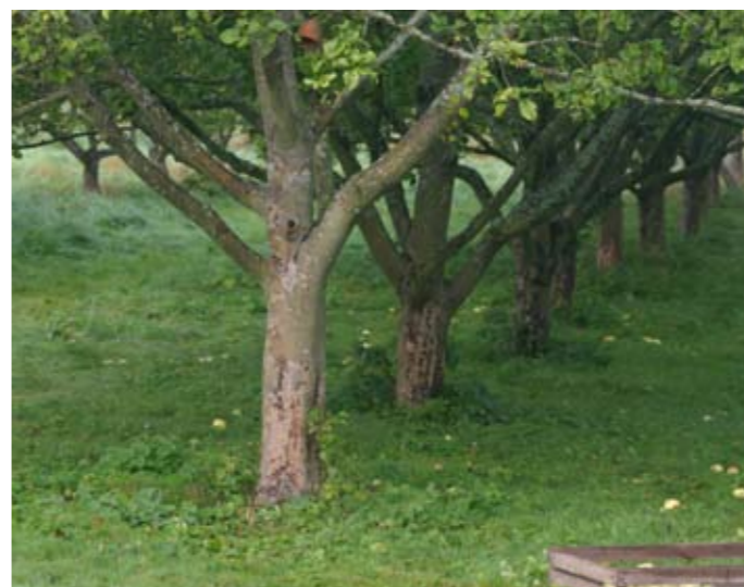
Stammar hos äppelsorten Filippa.