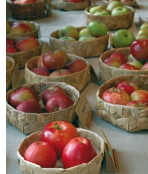
Under Mikaeli marknad, som är årets stora skörde- och allmogemarknad, besöker tusentals personer fruktutställningen.