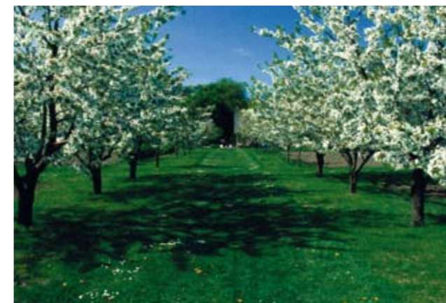
Det blommar och surrar av bin och humlor i Fredriksdals fruktträdgård.