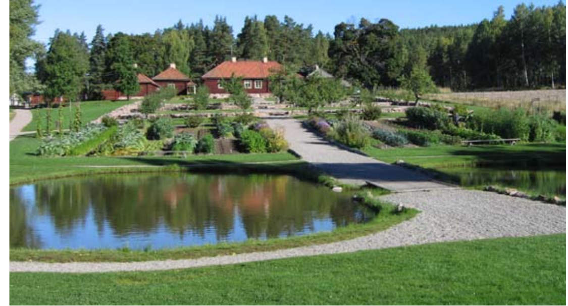
Gamla Staberg är en välbevarad bergsmansgård med anor från 1500-talet. Den terrasserade barockträdgården restaurerades under 1990-talet efter ritningar från 1758.

Gamla Staberg är beläget ca 10 km öster om Falun, nära sjön Runn.