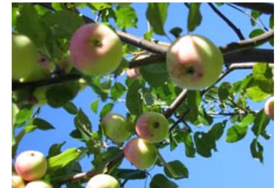
I fruktträdgården, som brer ut sig på fyra terrasser, bevaras dalasorter som Snilsäppet och Gubbäppet. Sorterna har förökats från moderträden i Nibble nära Hedemora respektive Källslätten utanför Falun. Gubbäppet – vars fruktkött är mjukt och lättätet – uppskattas enligt traditionen av tandlösa gubbar.