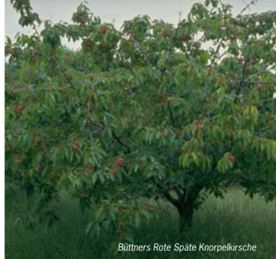
Büttners Rote Späte Knorpelkirsche