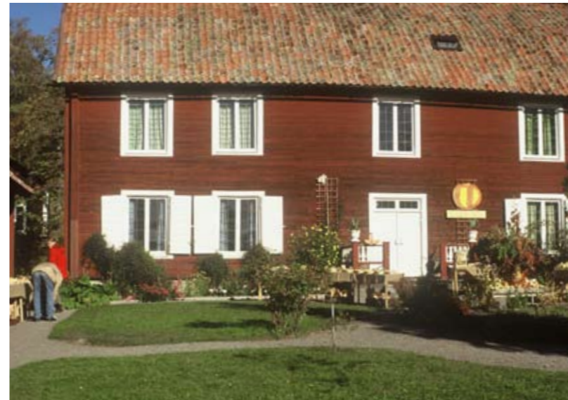
Carl von Linné köpte egendomen Hammarby 1758 och lät några år senare uppföra boningshuset i två våningar. Byggnaderna jämte samlingar och park ägs sedan 1880 av staten.

Från E4 vid Uppsala sväng vid trafikplats Kumla, avtag nr 187, till väg 282 mot Edsbro. Efter 0,5 km tag höger mot Danmarks kyrka och Linnés Hammarby.