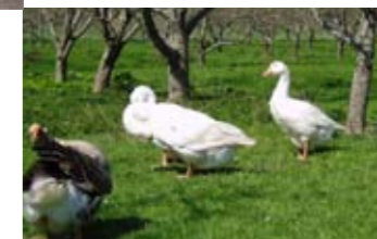
Capellagårdens gäss betar gräs och minskar antalet skadeinsekter.