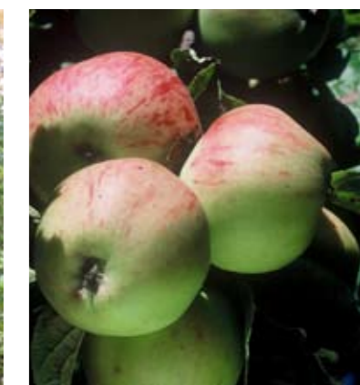
Den lokala äppelsorten Gylling från Ekebyhov fanns till försäljning i Ekebyhofs första plantskolekatalog, som utgavs 1920.