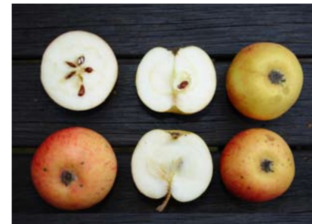
Linnés äpple är en sort som uppges komma från Stenbrohult. Frukten är en renettartad, god bordsfrukt som mognar i oktober och kan förvaras en månad. Trädet växer långsamt med välbyggd krona och ger goda skördar varje år.