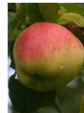
Filippa. Äpplet är uppkommet ur en kärnsådd från okänd sort. Sådden gjordes av den danska fröken Filippa Johannsen runt 1880. En sort som odlats mycket till försäljning, men nu är utkonkurrerad av andra sorter.