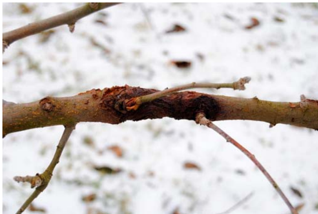
Bild 2. Skador på sidogren av Oranie, som är känd som en mycket mottaglig sort.

Angrepp på sidogrenarna påträffades hos 74 sorter (Bild 2). I många fall blev grenarna infekterade genom bladsår eller knoppsår, i vissa fall har smittan spridit sig från fruktsår eller från sår orsakade av t.ex. frostsador. Vi hittade mellan 1 och 10-11 skador per träd. Träd från 'Beauty of Bath' (förälder till 'Discovery') och 'Birgit Bonnier' hade 12 resp. 10 skador, och 'Discovery' hade 6.