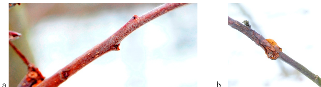
Bild 4. Infekterade bladsår på en ettårig kvist av Elise (a) och Ribston (b).

Bladsår anses vara huvudinkörsporten för svampen (Bild 4). I Belgien börjar ca 69% av alla infektioner i bladsår (M. Lateur, personligt meddelande). Hos vissa sorter kan varje bladsår på flera ettåriga kvistar vara infekterade. Infektion i bladsår på ettåriga kvistar upptäcktes hos 29 sorter. Det kan handla om ett enda infekterat bladsår ('Laxton's superb', 'Williams favorit') upp till 7 hårt angripna kvistar ('Discovery').