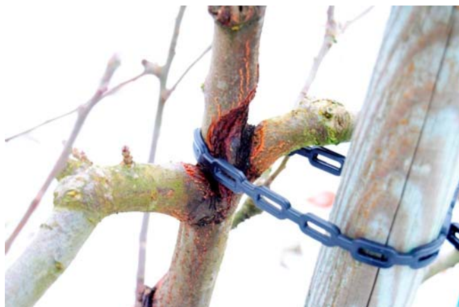
Bild 3. Kräftangrepp i grenvinkel.

Beskärningssår kan vara öppna för kräftinfektionen i ca en månad. Dock var inte infektionerna i beskärningssår särskilt vanligt förekommande i Balsgårds genbank: bara 20 sorter hade sådana skador.