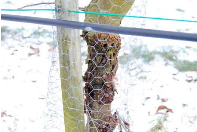
Bild 1. Kräftskador på huvudstammen. Troligtvis blev trädet smittat redan under förökningen.

Angrepp på sidogrenarna påträffades hos 74 sorter (Bild 2). I många fall blev grenarna infekterade genom bladsår eller knoppsår, i vissa fall har smittan spridit sig från fruktsår eller från sår orsakade av t.ex. frostsador. Vi hittade mellan 1 och 10-11 skador per träd. Träd från 'Beauty of Bath' (förälder till 'Discovery') och 'Birgit Bonnier' hade 12 resp. 10 skador, och 'Discovery' hade 6.