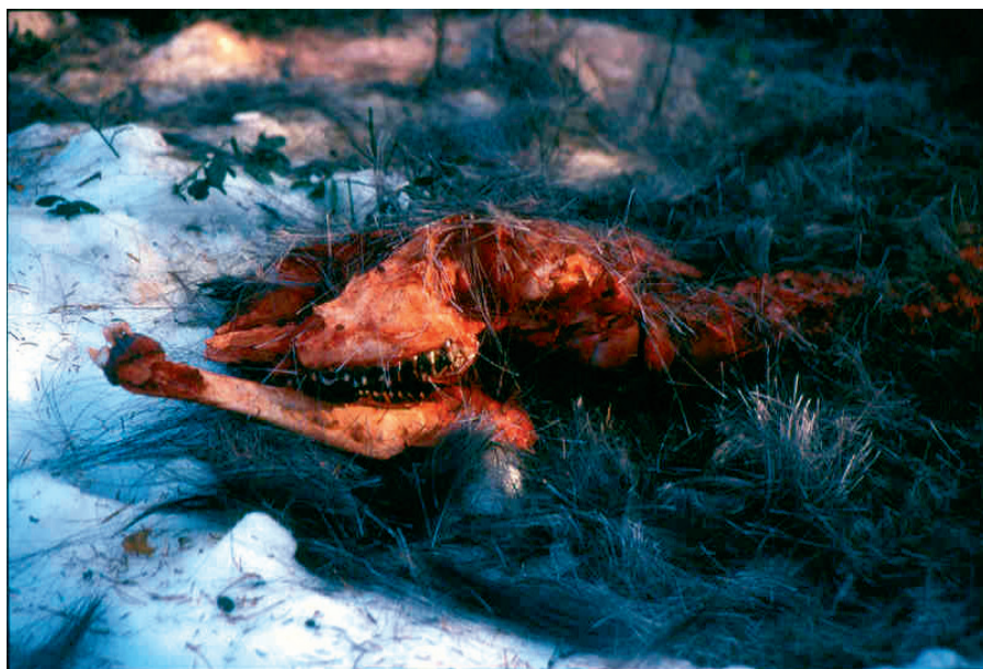
Figur 3. Vargdödad och delvis konsumerad älg.

En annan möjlighet är att jakten inte skulle representera ett slumpmässigt urval av individer i älgpopulationen. En studie av radiomärkta älgar i norra Sverige tyder på att så är fallet. Denna studie visade att äldre älgkor tenderade att i högre utsträckning få sina kalvar skjutna under jakt jämfört med älgkor i