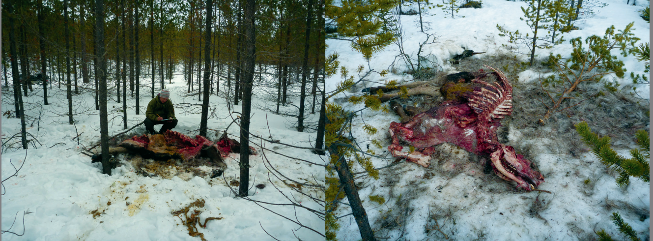
Insamling av käke och klassificering av en vargslagen älg i Tandsjöreviret i Härjedalen/Dalarna.

Håkan Sand ▪ Camilla Wikenros ▪ Per Ahlqvist