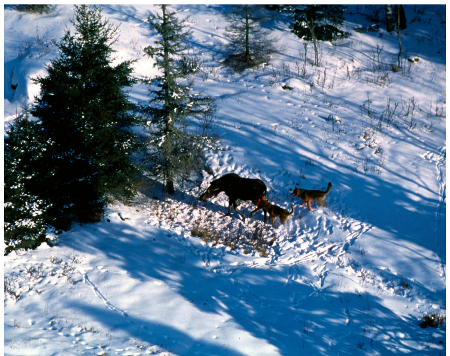
Figur 2. Två vargar attackerar en vuxen älg på Isle Royale, Michigan.

Älgen är det primära bytesdjuret för varg i Skandinavien i de flesta revir i vargens nuvarande utbredningsområde. Älg är också ett förhållandevis stort bytesdjur