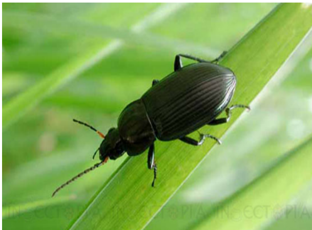
Art av Poecilus - ett släkte jordlöpare som är viktiga predatorer på skadedjur.

Åkrar producerar inte bara livsmedel, de är också boplatser för många växter och djur som kan förse oss med viktiga ekosystemtjänster. Ett exempel på detta är de naturliga fienderna, det vill säga de nyttoinsekter som kan bidra till en effektiv skadedjursbekämpning (så kallad biologisk bekämpning). Skalbaggar och spindlar är exempelvis naturliga fiender till många skadedjur i jordbruket, såsom bladlöss i vårkorn. Dessa naturliga fiender, eller predatorer som de också kallas, är generalister. Detta innebär att de inte bara äter skadedjur, utan också äter många andra djur i åkermarkerna. Men kan de fortfarande ge en effektiv biologisk bekämpning om de äter andra bytesdjur, även dem som inte är skadedjur? Utöver detta så är intensifieringen av jordbruket – särskilt vad gäller användningen av kemiska bekämpningsmedel – ett hot mot naturliga fienders mångfald och mängd i åkrar. Men vad behövs egentligen mångfalden för?