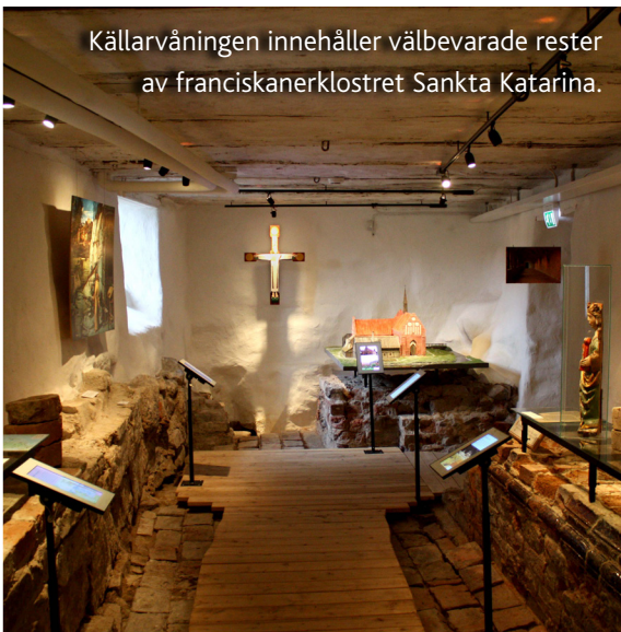
Källarvåningen innehåller välbevarade rester av franciskanerklostret Sankta Katarina.