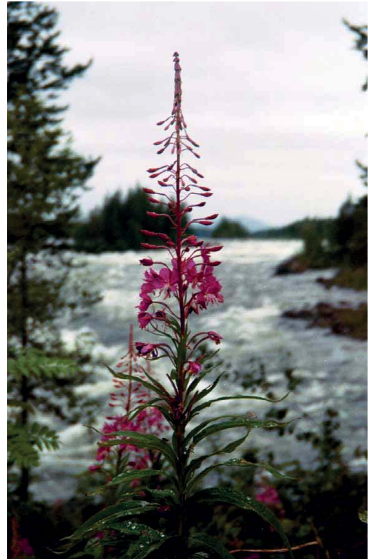
Rik natur, häftiga orörda forsar, vacker flora och intressant fauna vill turisterna gärna se och uppleva men det är nog inte det som beskriver Solanderledens kärnvärde.