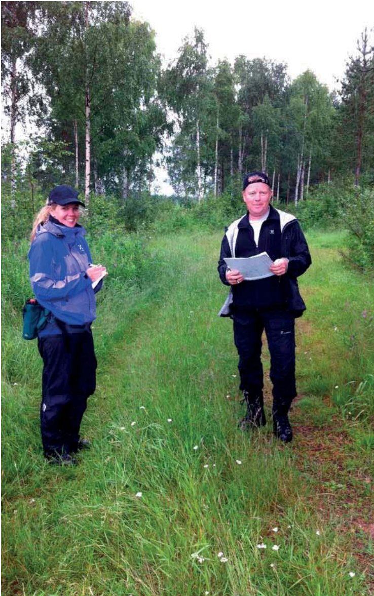
Lokala aktörer diskuterar ledens dragning så att den gynnar lokala ekonomin i regionen.