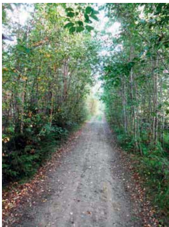
En vacker naturlig Pergola leder till Flottartigen från Pålberget.

Stormyrbergets lantgård är ett av Norrbottens mest etablerade företag med gårdsturism. Där erbjuds boende med ett tital bäddar (fler är planerade), restaurang med egna råvaror och besöksgård (får, höns mm), gårdsbutik samt olika aktiviteter såsom uthyrning av flotte, skogsguidning.