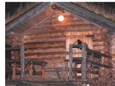
Vindskydd/rastplats i form av båtför.