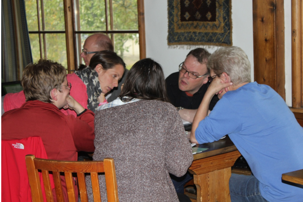
Intensiva gruppdiskussioner om naturvägledning för barn och unga pågick under två dagar på Jamtli i Östersund.

kunde beredas plats i projektet. Vid en workshop i Östersund i september samlades utöver projektgruppen ett trettiotal utvalda naturvägledare från alla de nordiska länderna samt Färöarna och två experter som deltog för att stödja processen. Ett uppföljande och avslutade möte hölls i Noux nationalpark i Finland i slutet av november där delar av slutrapporten tog form. Rapporten som kommer att presenteras i serien "Tema nord" blir klar våren 2013. Danmark har stått för projektledning.