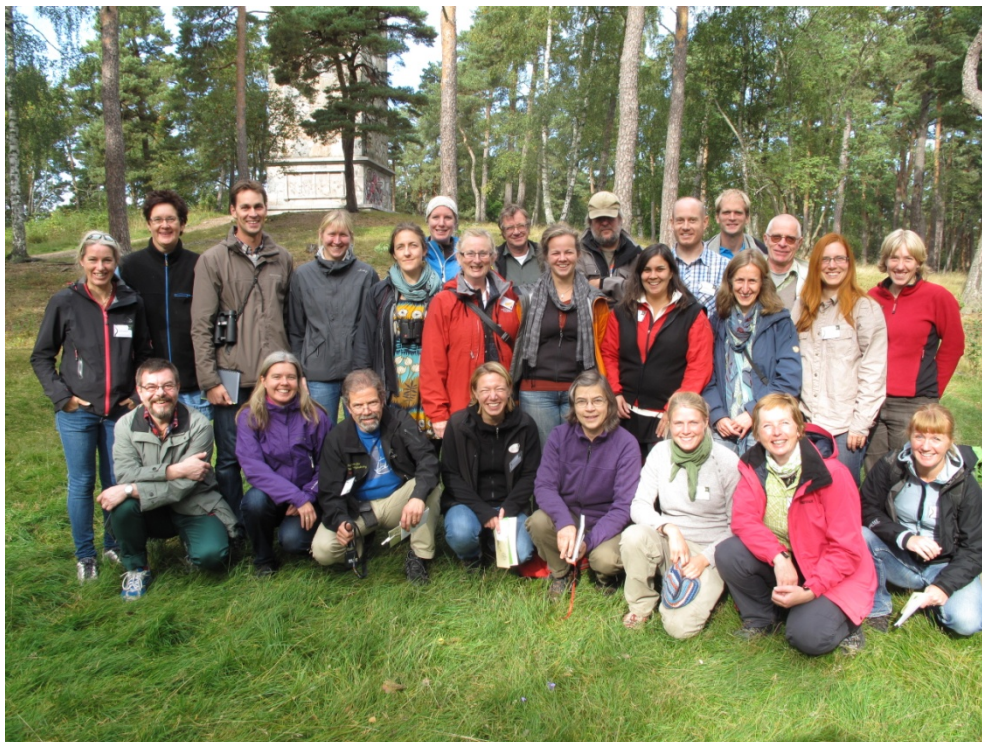
Kursen Naturvägledning för yrkesverksamma i Uppsala ht 2012.