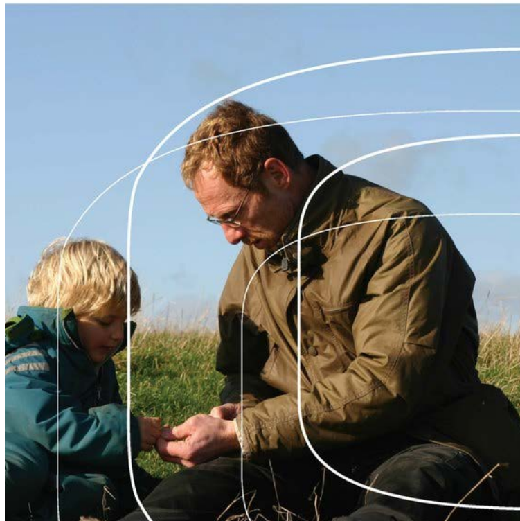
Den nordiska samarbetsgruppens rapport om naturvägledning för barn och unga i de nordiska länderna 2013.