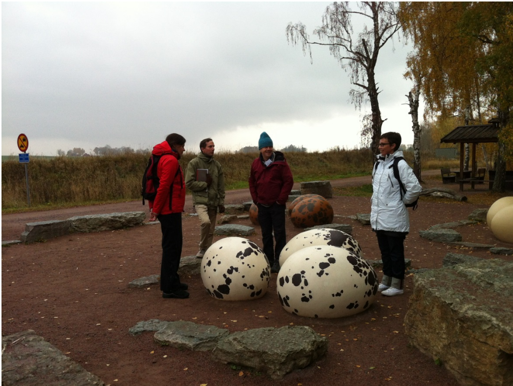
En workshop på tema Utställningar för stora idéer och små budgetar ägde rum vid naturum Tåkern i Östergötland.

Ett Seminarium om teknik för naturvägledning genomfördes i Kristianstad den 21 november i samarbete med naturum Vattenriket. Under seminariet presenterade sju inbjudna föreläsare tekniska lösningar för naturvägledning. Presentationerna handlade bland annat om planering för innovativa naturvägledningsidéer, tekniktrender i utställningssektorn, erfarenheter av appen Everytrail och Augmented Reality. Föreläsarna kom främst från Sverige, men även från England och Norge. Naturum Vattenriket berättade om sitt arbete med tekniska lösningar i utställningen och utomhus. Inför seminariet genomförde CNV en enkätundersökning bland drygt 30 naturvägledare om erfarenheter av projekt med appar. Resultatet från enkätundersökningen presenterades i rapportform under seminariet. Under dagen deltog 35 personer, främst från Sverige men även från Norge och Danmark.