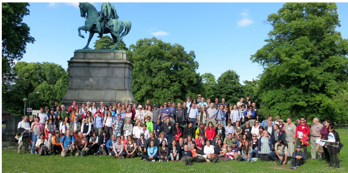
Deltagarna vid CNV:s konferens "Sharing our natural and cultural heritage – interpretation can make us citizens of the world" i juni 2013 samlade utanför Biologiska museet/Skansen i Stockholm.