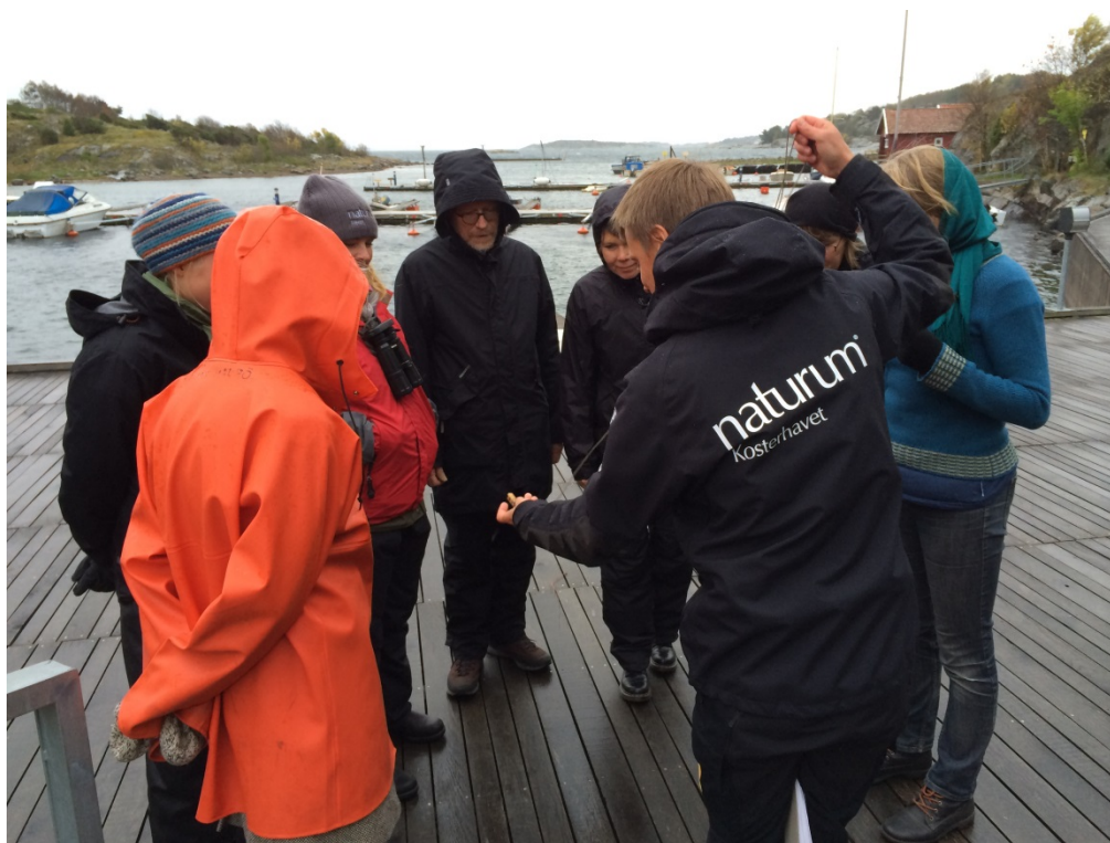
Workshop med naturvägledning i form av krabbfiske vid nationell naturumträff på Koster i oktober 2014.