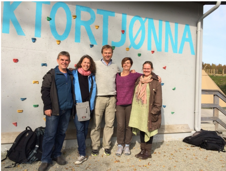
Den nordiska samarbetsgruppen sammanträdde vid doktors tjärn och naturcentret "Dokortjønna" i Röros i september 2014.

CNV:s nätverk (personer som aktivt bitt att få information från CNV) hade efter en rensning av registret 1684 medlemmar i slutet av 2014. Anslutna till CNV:s facebookside, gruppen Naturvägledare i Sverige och "Linked in" gruppen ökar stadigt.