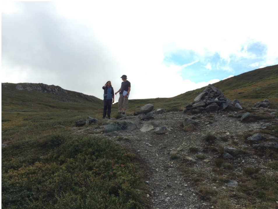
CNV besöker fjälleder i Marsfjällen tillsammans med Länsstyrelsen i Västerbotten

Arbetet med stöd till och utveckling av naturumverksamheten fortsatte med besök hos sex naturum. "Besökarnas tankar" en rapport från studien som genomfördes i samarbete med naturum 2013 för att testa utvärderingsmetoden "thought listing" (tankelistning) i utställningarna publicerades. Ett uppföljande projekt där naturum utvärderade guidningar med samma metod genomfördes.