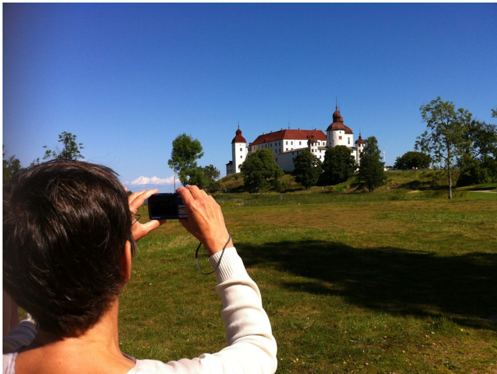
En workshop om utvärdering av publik verksamhet på museer leddes av CNV vid NAMSAS höstmöte på Läckö i september 2014.

CNV har under året föreläst på Naturhistoriska riksmuseet , vid Danska naturvägledarföreningens årsmöte i Danmark , för Lundellska gymnasiet i Uppsala, på kurs för Gröna entreprenörer i Alnarp och för Biologiska geovetenskapliga linjen vid Stockholms universitet. Om försöket med "thought listing" med naturum vid Friluftsforskningskonferensen och vid Interpret Europas konferens i Kroatien. Samt om naturvägledning för barn och unga vid Tankesmedjan för friluftsliv , för Naturens år-nätverket och för naturum (se nedan).