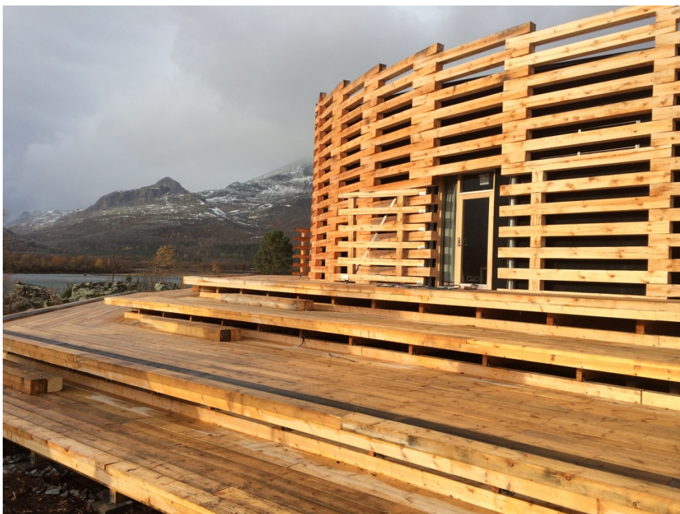
CNV deltog vid invigning av Naturum Laponia i september.