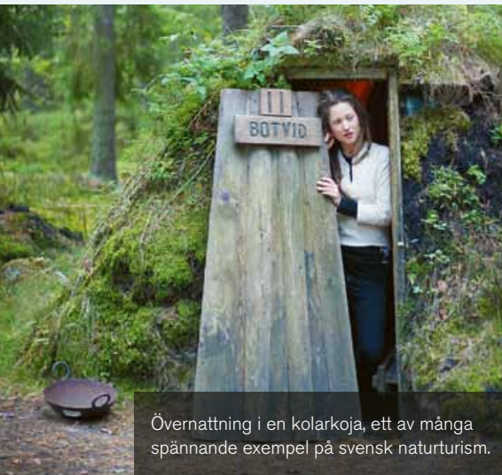
Övernattning i en kolarkoja, ett av många spännande exempel på svensk naturturism.

Sveriges 33 naturum arbetar brett med naturvägledning i alla former, både utomhus och inomhus: utställningar, guidade turer, natur- och kulturstigar, programverksamhet, utomhuspedagogik, digitala metoder med mera. Mötet med besökaren står alltid i fokus och naturum vänder sig till en bred allmänhet, inte minst barn och unga. Naturum fungerar som en port till naturen och är belägna i anslutning till attraktiva naturområden, från nationalparker till tätortsnära natur.