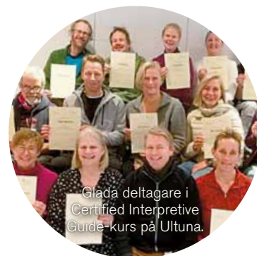
Glada deltagare i Certified Interpretive Guide-kurs på Ultuna.

CNV samarbetar med till exempel Utenavet, Naturens år, Interpret Europe, Föreningen för utbildningsnorm för naturguider (FUN), Svenskt friluftsliv, Naturturismföretagen, Naturhistoriska museers samverkansorganisation (NAMSA) och Nordiska samverkansgruppen för naturvägledning.