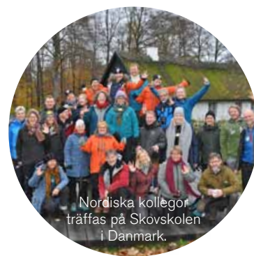
Nordiska kollegor träffas på Skövskolen i Danmark.

På vår webbplats hittar du artiklar, publikationer och annat användbart material som kan fungera som stöd för utveckling av naturvägledning.