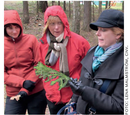
I EN INTRODUKTIONSÖVNING BERÄTTAR DELTAGARNA OM SIG SJÄLVA UTIFRÅN ETT FÖREMÅL DE HÄMTAT I LANDSKAPET. CNV:S KURS "DIALOG FÖR LANDSKAP", 2015.

I början av er tid tillsammans – oavsett om den är lång eller kort och om ni ses bara en gång eller flera – är det viktigt att alla får säga något. Ett sätt att göra det som också omedelbart tar in landskapet i samtalet är att be alla hämta något i omgivningen som de tycker säger något om dem själva, eller om landskapet. Om man vill kan man ge ganska gott om tid till denna hämtning, du kan be människor ta sin tid för att släppa allt de har i huvudet och bara ta in landskapet en stund. På din signal samlas ni sedan och alla säger något om sig själva och det de hämtat. Om ni är många kan du behöva begränsa tiden deltagarna har till sitt förfogande. Är ni riktigt många kanske det bara blir två ord per person. Du kan också dela upp deltagarna i grupper om 4-5 som presenterar sig inbördes.