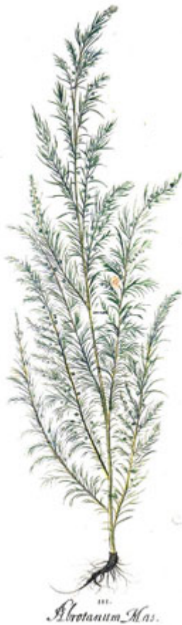
III. ARTEMISIA ABSINTHIUM Eberm.

Växten tillskrevs också galldrivande, antiseptisk och sår-läkande verkan. Åbrodd "förekommer hastig förruttelse" och därför rekommenderades omslag för att hindra kallbrandens snabba förlopp. Åbrodd liksom humle användes som "balsamisk ört", som man la i kistan runt den döde för att förhindra förruttelseprocessen. Att göra dekokter av växten och tvätta sig med skulle vara ett sätt att bli kvitt skabb.