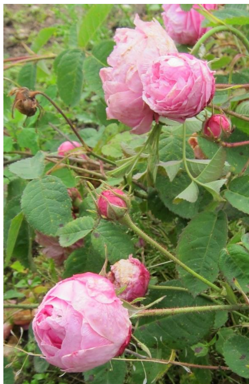
'Major' - mormorsros