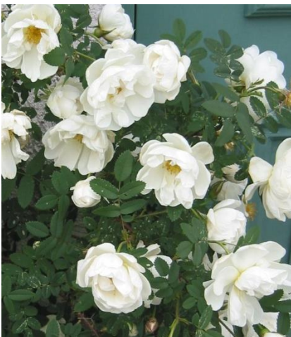
'Finlands vita' ('Plena')