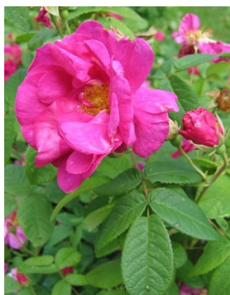
'Officinalis' - apotekarros