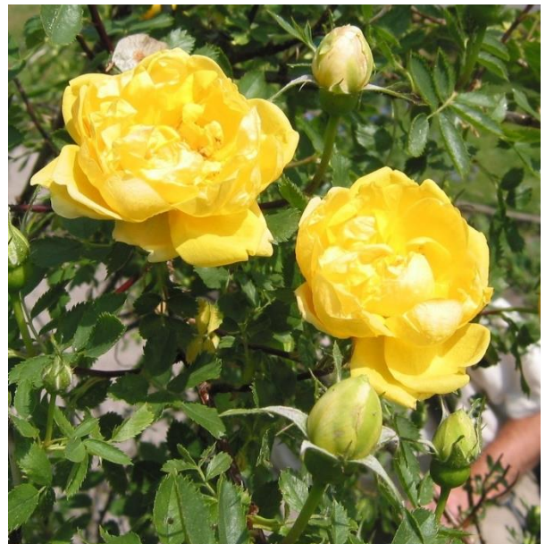
'Persiana' – persisk gulros