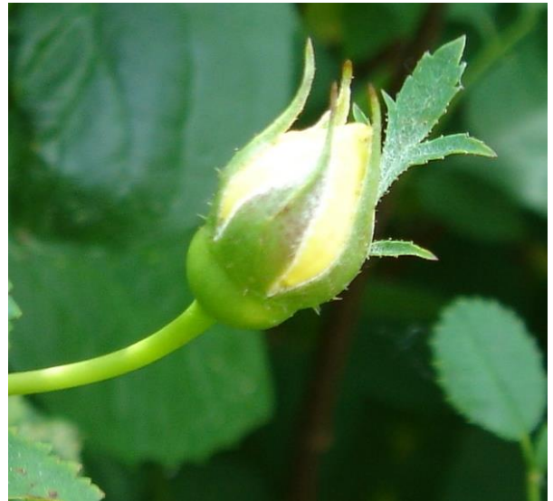
'Williams Double Yellow' (har kal blombotten)

Blommor vanligen halvfyllda-fyllda i ljust till mer mättat gula nyanser. Sorten 'Persiana' är starkt svavelgul. Särpräglad hartslik doft. Blombottnar med eller utan borsttaggar beroende på sort. Bildas nypor är dessa vanligen mörka