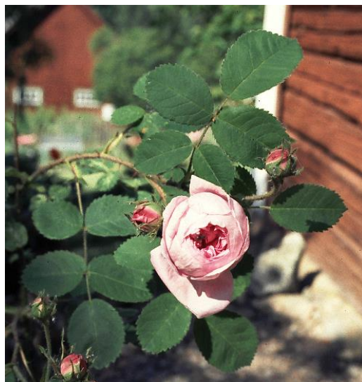
'Major' - mormorsros

Den kanske vanligaste äldre mossrosen, 'Communis', är dock en mutant av 'Major' här intill och är således en riktig Centifolia Muscosa-ros.