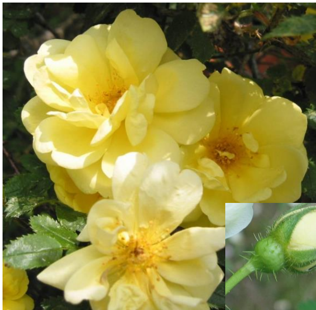
'Harison's Yellow' (har bortstaggat på blombotten)