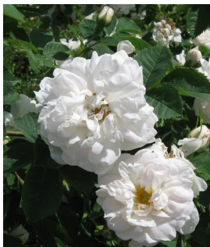
'Alba Maxima' – vit bondros