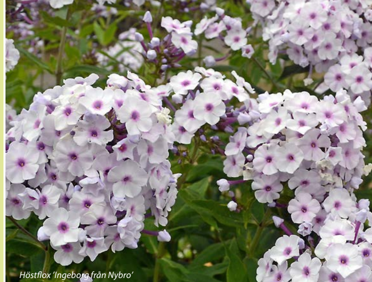
Höstflox 'Ingeborg från Nybro'