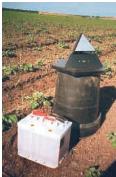
Reflekterande pyramid

startar och stänger av motorn. Pyramidens reflekterande del (12 cm hög) är i ständig rörelse och de ljusreflekterande speglarna på pyramidens sidor skapar störande ljusrörelser som skall avskräcka de från luften annalkande fåglarna. Pyramiden har även använts i Sverige med av användaren uppgiven god effekt. Vid Kvismaren anses den vara jämförbar med gasolkanonen.