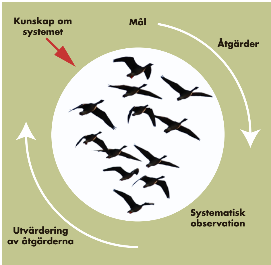
Figur 2. Genom kunskap om fåglarnas ekologi och konflikten mellan skadegörande fåglar och lantbrukare kan lämpliga skadeförebyggande åtgärder utföras. För att vidareutveckla detta arbete krävs att man observerar och utvärderar åtgärderna för att kontinuerligt öka kunskapen. Förvaltningen bör också i ett tidigt skede sätta upp mål för de åtgärder man väljer att genomföra.

antalet skador, ekonomi och berörda människors attityder till skadegörande fåglar. Den här typen av utvärderingar är svårare att göra. I framtiden bör utveckling av metoder för att få mer kunskap om detta prioriteras.