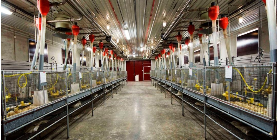
Figur 1. Smågruppsmodul från Lövsta forskningscentrum, SLU som användes i både raps- och åkerböna försöket.