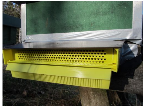
Pollenfällan i stängt läge.

Bina kan fritt flyga in och ut av kupan. Pollengallret kan enkelt hållas i öppet läge med hjälp av en klädnyppa. Observera att alla springor runt fällan ska täppas igen, t.ex. med silvertape, så att bina bara kan ta sig in genom pollengallret när det stängts.