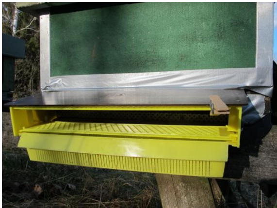
Pollenfällan i öppet läge.

För att undvika den öppningen kan du skruva på en trälist, som i exemplet på bilden här. Förborra ett hål på varje sida av pollenfällan och skruva dit trälisten.