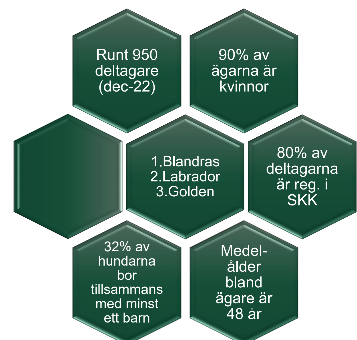
SNABBFAKTA: beskrivning av våra deltagare (dec-22)