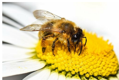
Pandemin har drabbat