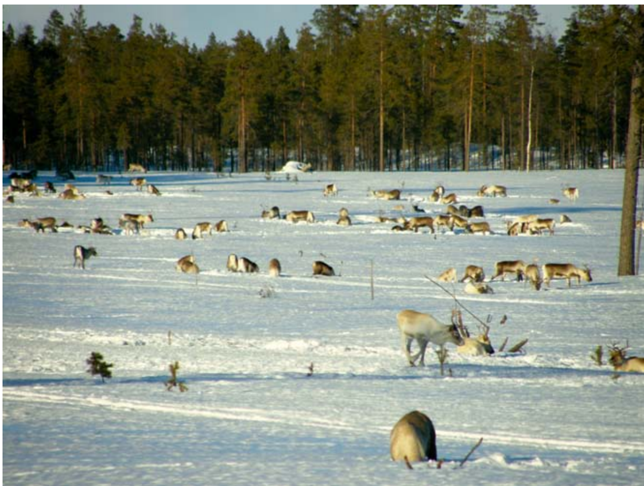
FIGUR 1. Betande renhjord under vårvinter i Västerbottens kustland.