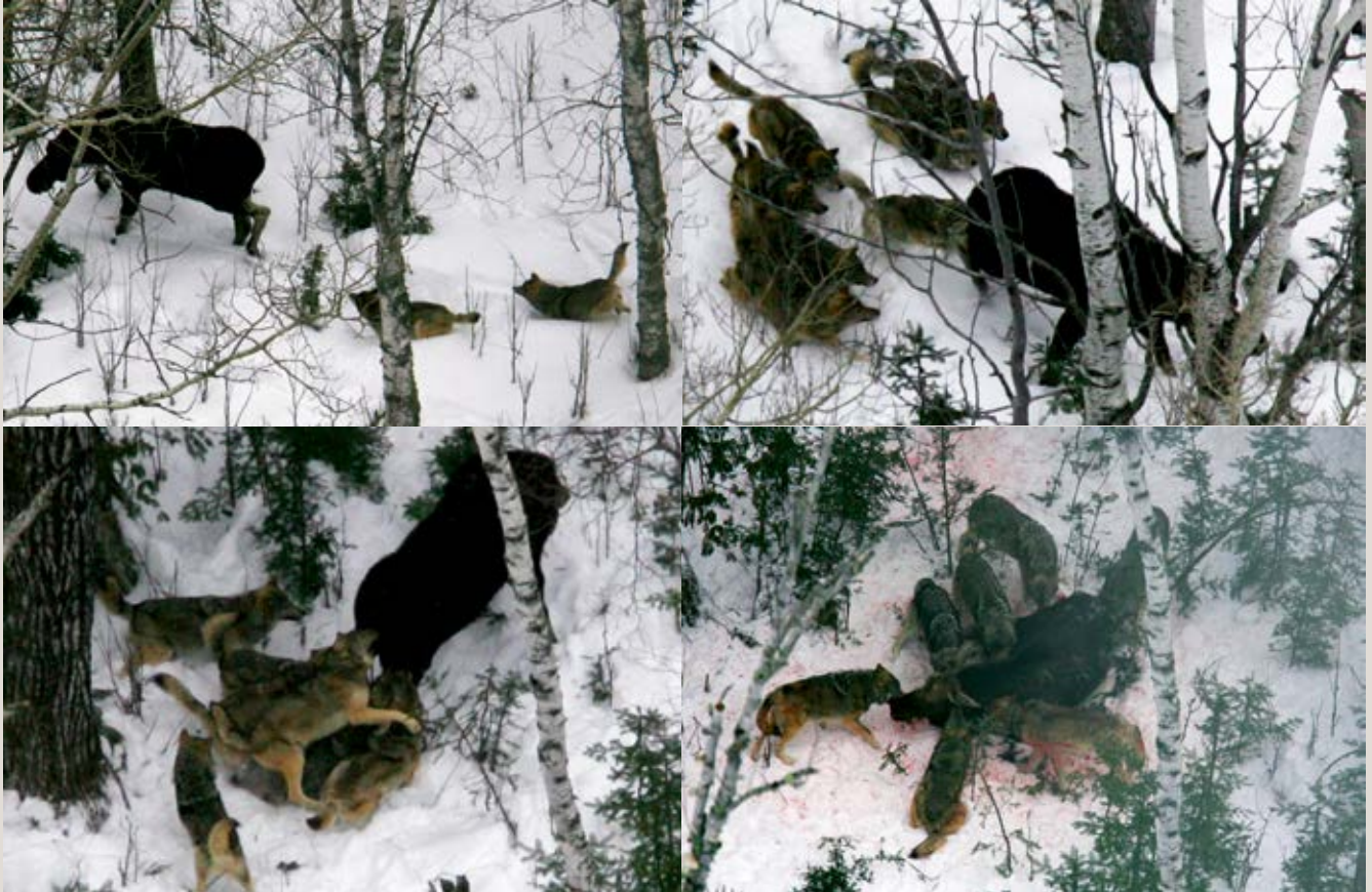
Vargar på Isle Royale attackerar en vuxen älgdjur.