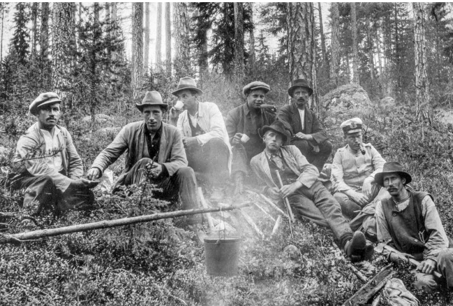
I skogarna väster om Malträsk 1923.