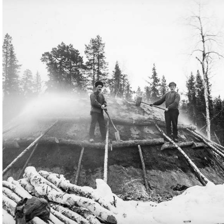
Kolmila i Vindelintrakten.