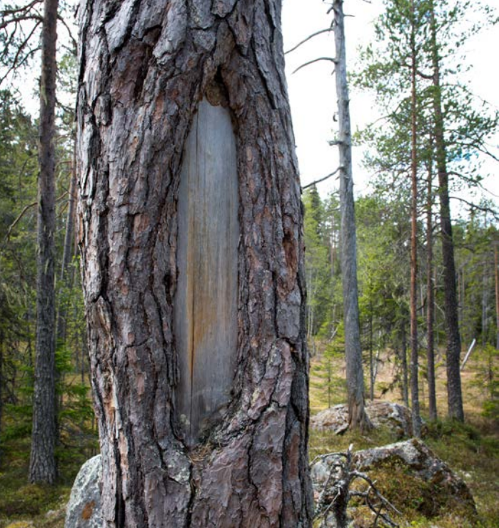
Barktäkt, Kåringberget. Spår av samers skörd av tallens innerbark, som användes i mat.