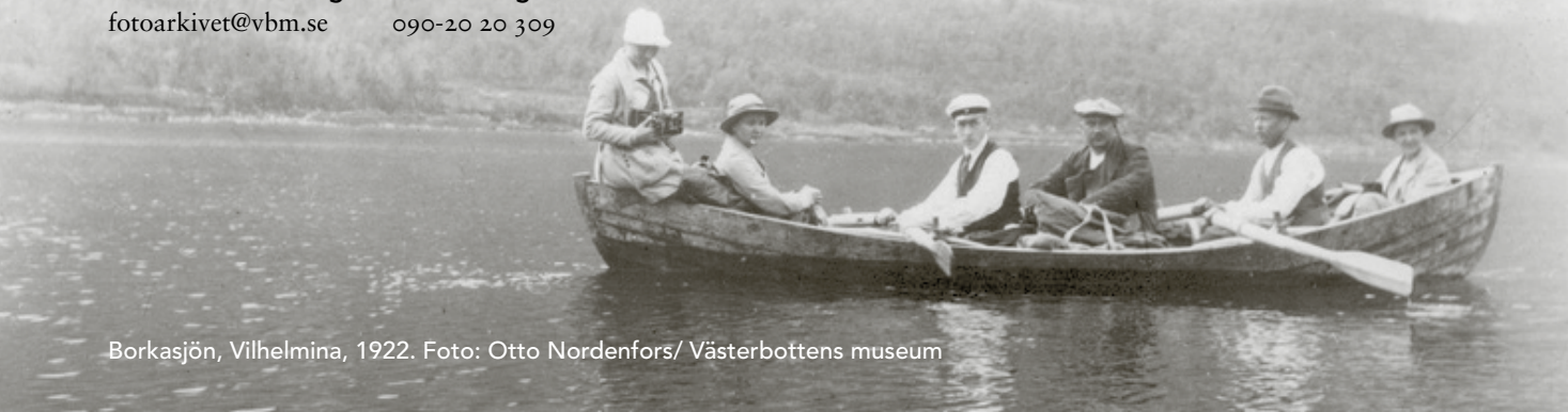
Borkasjön, Vilhelmina, 1922.