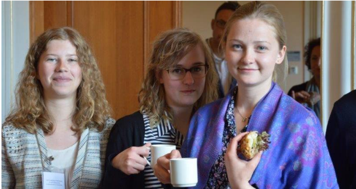
Tre konferensdeltagare från SLU.