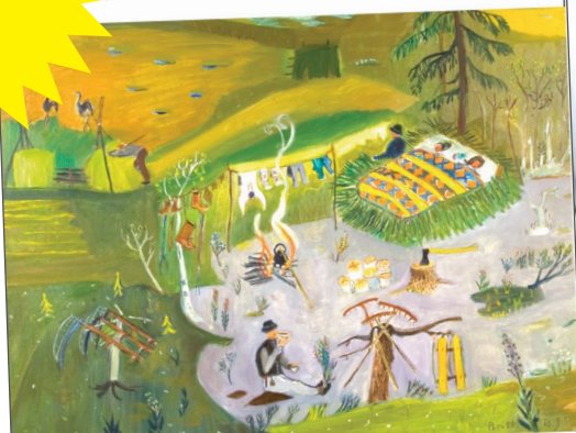
1. Träd och växter som resurs