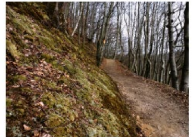
Offavägen, halvvägs upp för dalsidan.