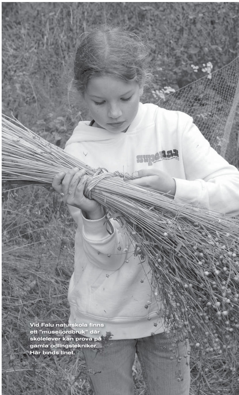
Vid Falu naturskola finns ett "museijordbruk" där skolelever kan prova på gamla odlingstekniker. Här binds linet.