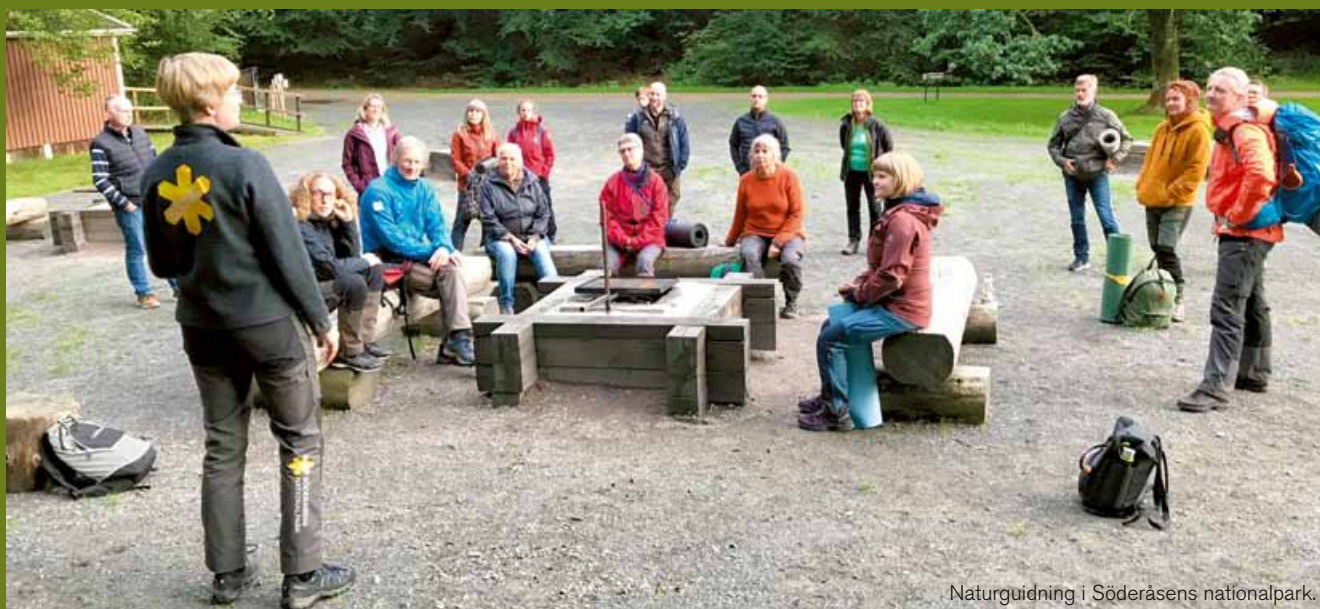
Naturguidning i Söderåsens nationalpark.