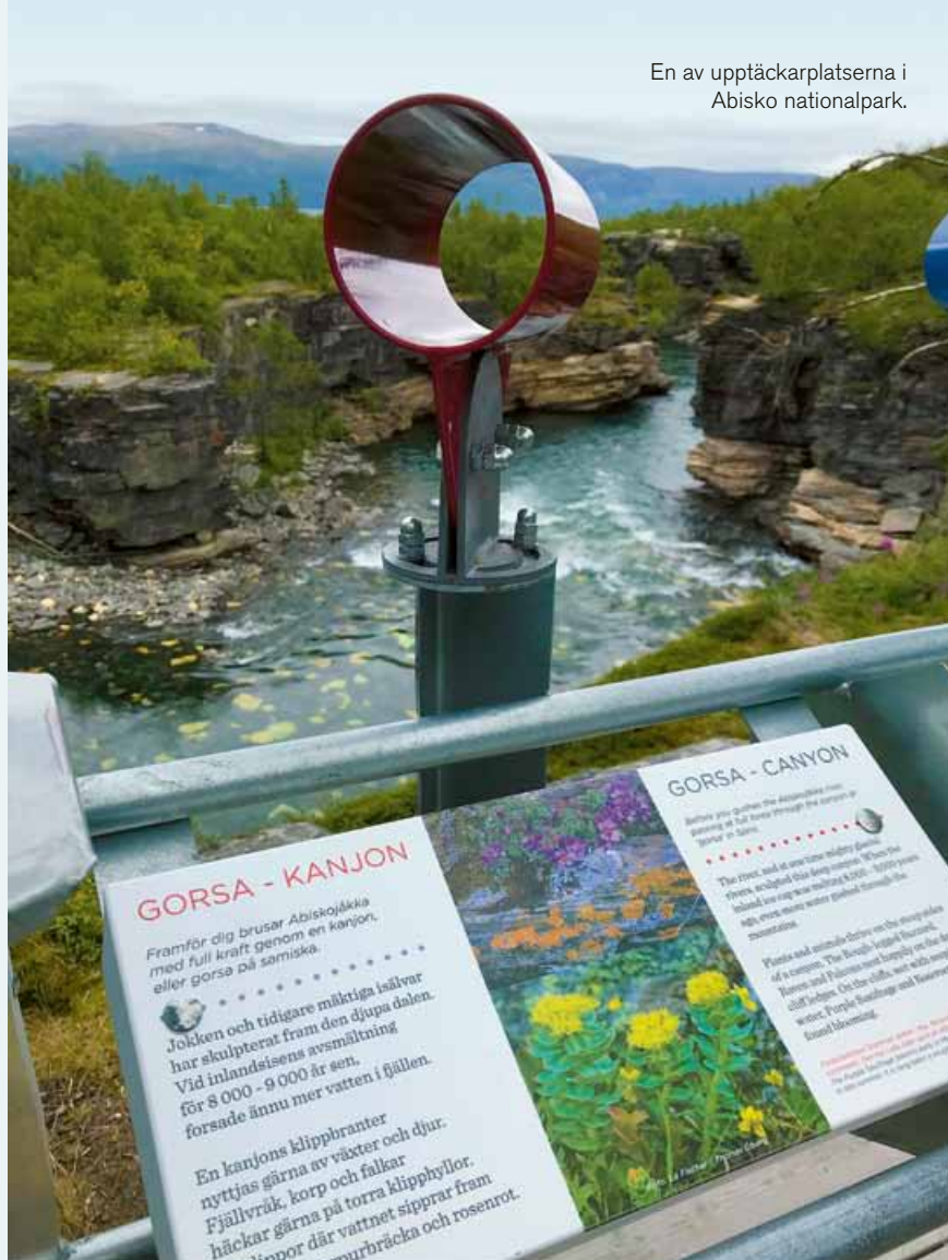
En av upptäckarplatserna i Abisko nationalpark.

I Abisko nationalpark finns nio upptäckarplatser. Genom att titta i rören fokuseras din uppmärksamhet på fenomenen i landskapet som det fågelrika deltat vid Torne träsk, bergarterna i Abiskojokkens kanjon, det klara vattnet där strömstaren dyker, stugan där Selma Lagerlöf bodde en gång eller den blå himlen – den är ofta det i Abisko. På en skylt vid kikaren får du veta mer om det du ser och vad det betyder.