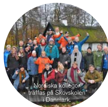
Nordiska kollegor träffas på Skövskolen i Danmark.

På vår webbplats hittar du artiklar, publikationer och annat användbart material som kan fungera som stöd för utveckling av naturvägledning.