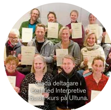
Glada deltagare i Certified Interpretive Guide-kurs på Ultuna.

CNV samarbetar med till exempel Utenavet, Naturens år, Interpret Europe, Föreningen för utbildningsnorm för naturguider (FUN), Svenskt friluftsliv, Naturturismföretagen, Naturhistoriska museers samverkansorganisation (NAMSA) och Nordiska samverkansgruppen för naturvägledning.