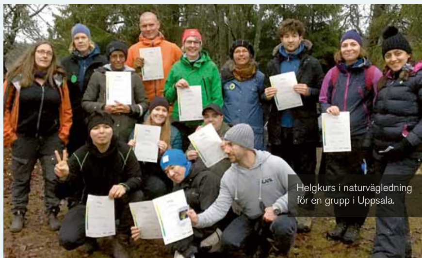
Helgkurs i naturvägledning för en grupp i Uppsala.

Naturvägledare som kan både svenska och sitt, eller sina, hemspråk fungerar som brobyggare mellan det svenska samhället och nyanlända grupper. Den nya kulturen, naturen och samhället blir mer förståeliga tack vare att det finns personer som kan vägleda på deras hemspråk. Här har ett gäng med både ”nya och gamla” svenskar i Uppsalaområdet fått en helgkurs i naturvägledning av Naturskyddsföreningen i Örebro län.