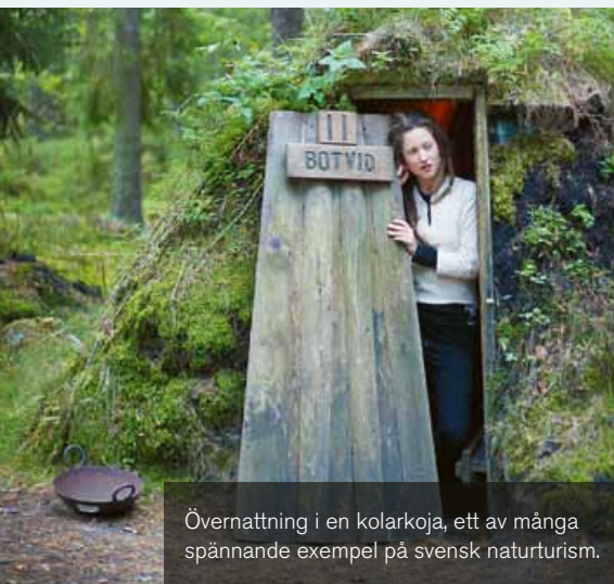
Övernattning i en kolarkoja, ett av många spännande exempel på svensk naturturism.

Sveriges 33 naturum arbetar brett med naturvägledning i alla former, både utomhus och inomhus: utställningar, guidade turer, natur- och kulturstigar, programverksamhet, utomhuspedagogik, digitala metoder med mera. Mötet med besökaren står alltid i fokus och naturum vänder sig till en bred allmänhet, inte minst barn och unga. Naturum fungerar som en port till naturen och är belägna i anslutning till attraktiva naturområden, från nationalparker till tätortsnära natur.