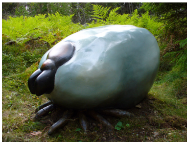
Rid på en fästing.

Vad är det bästa med stigen? Att den lyfter fram viktiga frågor i en form som förhoppningsvis gör att fler kan ta till sig informationen. Skyltar kompletteras med inslag som stimulerar nyfikenheten – öppna luckan i trädet och se vem som bor där, lyssna på insekterna som gnager under barken, rid på en fästing och vada ut i vattnet och försök att hitta havsborstmasken! Genom mixen av fakta och lekfulla inslag bli leden en spännande, intresseväckande och lärorik vandring för stora och små. Läs mer på www.cnv.nu .