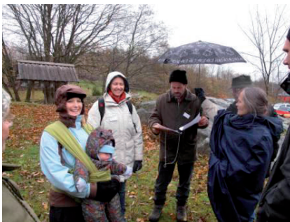
CNV seminarium i Uddevalla november 2009.