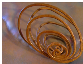
Skulptur av Kajsa Grebäck