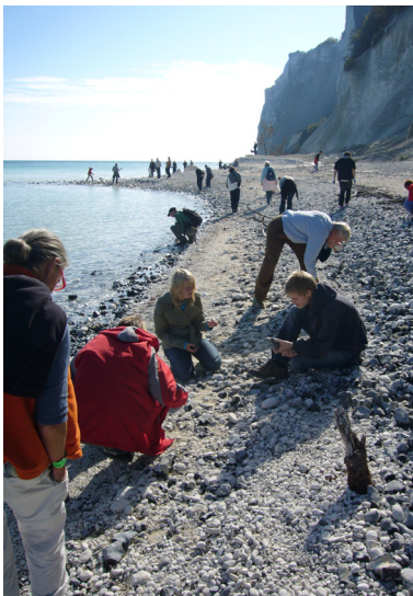
Fossiljakt vid Möns klint.

När man står på toppen av Möns klint befinner man sig 128 meter över havet. Hela Danmark är uppbyggt på ett kritfundament och på Möns klint blir det tydligt vilka krafter som har skapat landet.