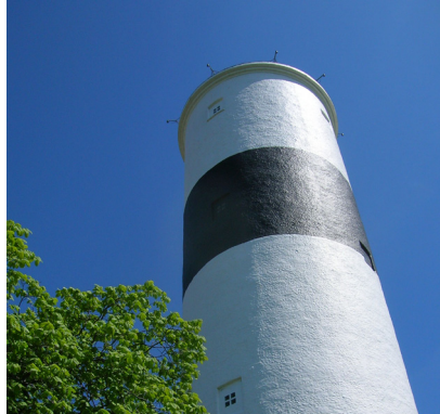
Långe Jan från 1785 är byggd av öländsk kalksten.

Jan berättar om tio års geologiska naturvägledningsprojekt på Öland. Sveriges första Geopark med 10-12 intressanta platser på Öland är nu under framväxande. Gillberga bergbrott på norra Öland ska bli en geologisk upplevelseplats kring kalkstenens natur- och kulturhistoria. Invigningen av dessa attraktioner är planerad till våren 2012.