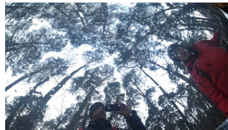
Nya perspektiv längs Linnéstigarna.

Stadsnära naturvägledning handlar ofta om att intressera naturovana grupper. Mobil teknik ger nya möjligheter – precis som fågelskådaren med sin kikare kan en besökare få ut mer av sitt naturbesök med en smart telefon. Det hade jag i bak-huvudet när jag 2011 involverades i utvecklingen av nya Linnéstigar i Uppsala.