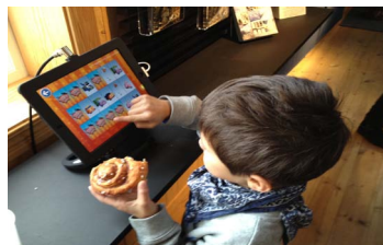
Ny teknik och klassiskt fika i naturum.

Nya tekniklösningar på naturum Kullaberg är skyltar med bild, nummer och QR-kod till 17 platser längs Kullabergs vandringsstig, en "Kullaberg-app" med virtuell skattjakt i omgivningarna, en pek-skärm med interaktiv resa i Kullabergs mångfaceterade natur, fyra interaktiva spel och en kamera som kontinuerligt visar häckande pilgrimsfalkar på en klippavsats i reservatet.