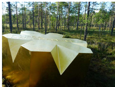
Nationalparksidentitet i form av kronjuvel vid entrén till nyinvidgade Hamra nationalpark.

Det ska vara enkelt och engagerande att ta till sig det vi berättar, med mer bild än text och så ofta det går kompletterat med ljud och modeller. Varje entré ska förses med en samlingsplats där lättillgänglig information förmedlas – en modell av nationalparken, en ljudkälla med inläst information samt lättläst text och bild. I Hamra nationalpark har informationssystemet utformats enligt det nya varumärket, med bland annat en vevbar mp3-spelare. Besökaren kan lyssna på en berättande introduktion på tre språk till platsen samt lyssna på olika djurläten.