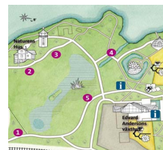
Kartan över våtmarkerna vid Bergianska trädgården.

Albaeco har tillsammans med Vetenskapens Hus och med stöd av Svensk Våtmarksfond tagit fram en audioguide till en nyanlagd våtmark i Bergianska trädgården, Stockholm. Den kan laddas ned som mp3-ljudfil tillsammans med en karta och guidar lyssnaren till vad våtmarker kan vara bra för (ekosystemtjänster) samt vilka djur och växter som behöver våtmarker. Dessutom berättas spännande fakta om områdets historia, som att Gustav III lät gräva kanaler här för att åka gondol mellan Haga slott och vännerna runt omkring.