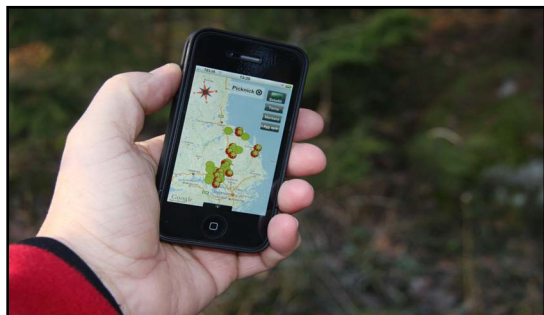
Naturtipset visar här Smultronställen i naturen i Uppsala län - ett samarbete mellan Upplandsstiftelsen, Biotopia och länets kommuner för att tillgängliggöra lättbesökta och värdefulla naturutflyktsmål.

På Upplandsstiftelsen hade vi precis fått smartphones. Få hade haft någon tidigare och vi hade ingen erfarenhet av applikationer. För att komma igång studerade vi andra appar, både svenska och utländska, och plockade de bästa idéerna. Vi skrev ett utförligt offertunderlag och av de offerter som kom in valde vi en från ett Uppsala-företag. Snabbt lämnade vi in en bidragsansökan till Landsbygdsprogrammet och så fort den blev godkänd satte vi igång. Tack vare att vi just gjort om och uppdaterat vår hemsida var det lätt att flytta över informationen från den till appen.