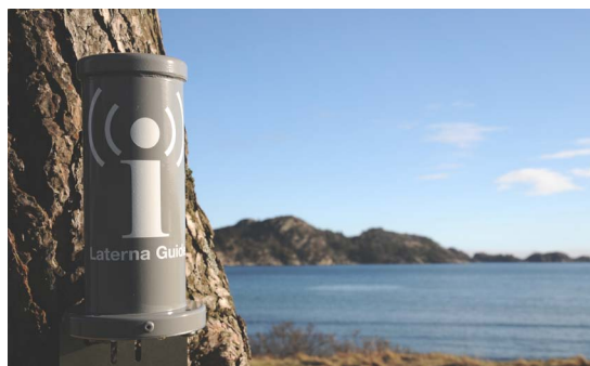
Så här ser den ut på plats - Laterna Guide.

Enkelt och stort. En röst, ett ljud. Minnen. Vi lever i en tid där teknik gör det möjligt att enkelt sprida berättelser med god kvalitet. Laterna Guide är en platsbunden mobilguide, utvecklad i ett norskt-svenskt samarbete. Guiden ser ut som en ”informationsfyr”, och i den finns både nödvändig teknik (webbserver) och innehåll (html, ljud, text och bild). Samtidigt kan den fungera som en skylt. Besökare loggar på det öppna wifi-nätverket som guiden ger och innehållet presenteras via mobiltelefoners webbläsare. Man kan också använda surfplattor. Eftersom ingen internetuppkoppling behövs blir det helt gratis även för utländska turister. Guiden blir som en autonom surfpunkt. Inte heller någon applikation blir nödvändig.