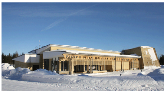
Naava naturum i Pyhä-Luosto nationalpark, med Finlands sydligaste fjällområde, cirka åtta mil nordost om Rovaniemi.

- Avtalen med företagen tecknas på frivillig bas och som motprestation får man bland annat en länk till företaget från Forststyrelsens webbplats www.utinaturen.fi . Cirka 300 sådana treåriga avtal är i kraft idag, berättar Carina. Målet med samarbetet är en hållbar naturturism inom exempelvis nationalparker. Både Forststyrelsens och företagets verksamheter ska göras mer kända och attraktiva genom samverkan. Avtalen reglerar också företagets användning av nationalparkens serviceanordningar.