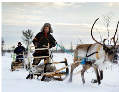
Upplevelser med renen och den samiska kulturen leder vägen in i naturen.