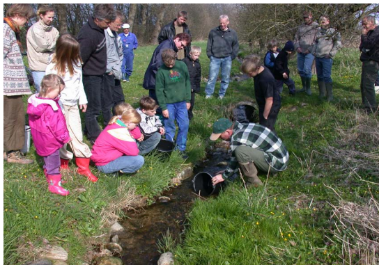
Barn och föräldrar sätter ut fiskyngel i en restaurerad bäck - ett projekt där naturvägledare arbetar med frivilliga krafter.

Leif H. Sørensen på naturskolan Trente Mølle är nationell koordinatör för borgerinddragelse i den danska naturvägledarföreningen. Han berättar att danska naturvägledare ofta arbetar med borgerinddragelse vid planering och skötsel av naturområden. Man engagerar till exempel skolklasser i naturvårdsarbete. I Kolding kommun får skolbarn och andra lokalboende hjälpa till att restaurera kommunens vattendrag. I Brønderslev