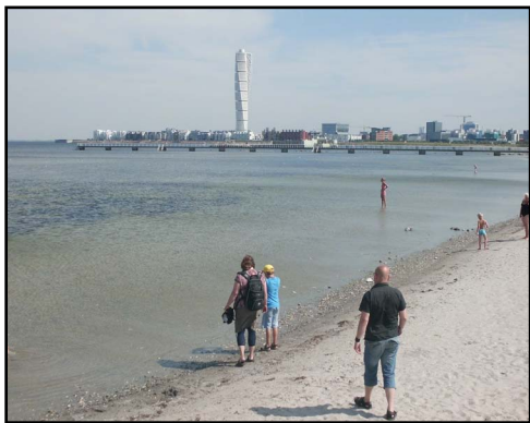
Ribersborg - stranden mitt i Malmö och en av de platser där Vilda Malmö håller guidade promenader.

Sedan 20XX finns ett guidenätverk som kallar sig Vilda Malmö och som har gjort guidning i närnatur till en företagsidé. Man guidar på fasta tider eller på beställning för små grupper så att alla får en upplevelse. Guiderna är både artexperter och pedagoger