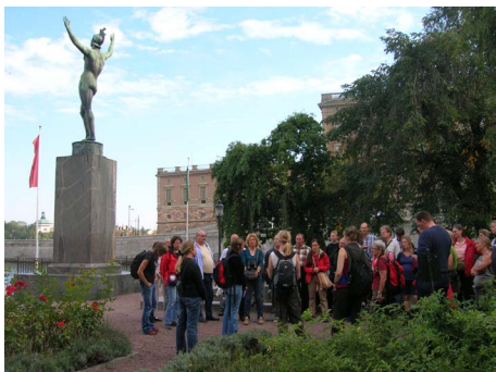
Storstockholms naturguider drar sig inte för att guida mitt i stadens hjärta.

Varje söndag, året runt, i nu snart tio år, har Storstockholms naturguider inspirerat stockholmare att följa med ut i naturen på en guidning eller till att upptäcka det gröna inne i stan.