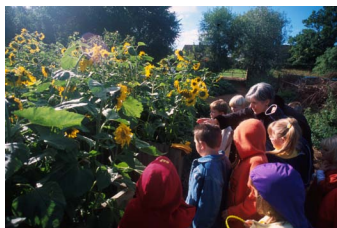
I hembygdsrörelsen vill man främja möten i landskapet över generationsgränserna.

Gamla tiders brukande av naturen och landskapet utvecklade en detaljerad lokalkännedom och kunskap om naturens rikedomar och möjligheter men också dess gränser. I denna traditionella kunskap finns mycket att hämta inför dagens utmaningar och omställning till ett hållbart samhälle.