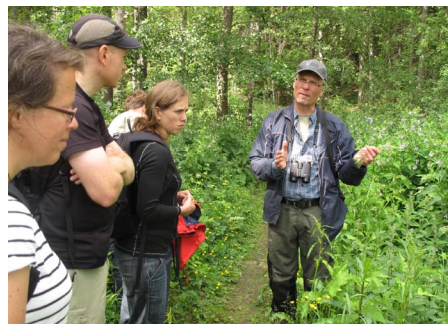
Djupgrön naturprofil eller demokratisk processledare? Från guidning med Upplandsstiftelsen och CNV 2012.