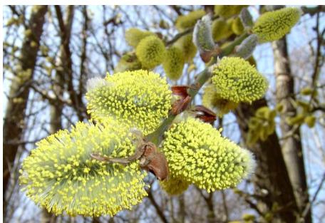
Klassiskt vårtecken - blommande sälg. Låt dina vårobse- vationer bli del av en större helhet!

Följer du naturens kalender? Då kan du samverka med våra förfäder och bidra till övervakning och forskning om klimatförändringens biologiska effekter.