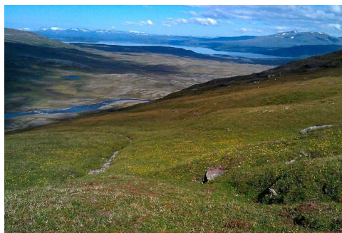
Betat landskap med fjällviolier i Badjelánnda.

- Det gäller att tala till känslan av att det är allas vårt världsarv, med respekt och förståelse för olika perspektiv och för människans påverkan på naturen. Det krävs en mänsklig ingång för att beröra och engagera. Därför planerar vi till exempel kortfilmer med berättelser i utställningarna - byggda på intervjuer med olika personer med en relation till Laponia, antingen de lever och verkar i området eller är här för natur- och kulturupplevelser.