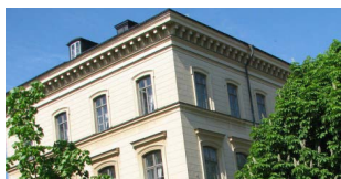
I KSLA:s hus nära Observatorielunden i Stockholm har flera seminarier om landskapskonventionen ägt rum.

I maj 2011, när den europeiska landskapskonventionen trädde i kraft i Sverige, anordnade Kungl. Skogs- och Lantbruksakademien (KSLA) ett seminarium om konventionen tillsammans med Riksantikvarieämbetet och Kungl. Vitterhets-, Historie- och Antikvitetsakademien. Seminariet med titeln "Landskapsperspektiv – hur gör det