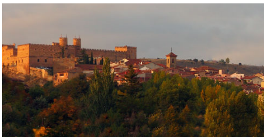
Interpret Europe Web Conference | 1-4 October 2021