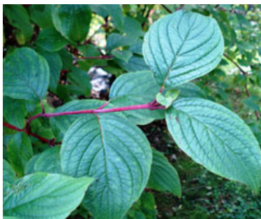
Rysk kornell ( Cornus alba ), sorten 'Sibirica', även kallad Korallkornell.

• Videkornell ( Cornus stolonifera eller Cornus alba ssp. stolonifera ) skjuter rotskott och har rotsläende grenar. Dess blad är ganska stora med killik bas. Där den trivs bildar den lätt täta bestånd, och den återfinns inte sällan förvildad. Videkornell kommer från Nordamerika och introducerades till Europa redan på 1600-talet. Arten klarar sig allmänt upp till zon 5.