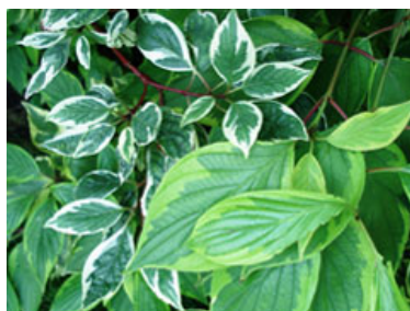
Två sorter av rysk kornell med olika bladfärg - överst till vänster 'Sibirica Variegata', även kallad Vitbrokig Korallkornell, nederst till höger den gulbrokiga sorten 'Gouchaultii'.

Kornellen var som mest populär i svenska trädgårdar vid 1900-talets början. På 1860-talet erbjöd Alnarps trädgårdar fyra Cornus -arter till försäljning. Antalet erbjudna sorter ökade därefter stadigt för att nå sin topp under under 1900-talets första årtionde, då antalet poster under släktet Cornus i Alnarps trädgårdars kataloger var hela 32. Därefter sjönk antalet igen. På Träd- och buskuppets hemsida kan du läsa mer om olika Cornus -sorter som funnits i svenska plantskolekataloger från 1860-1940. Läs mer >