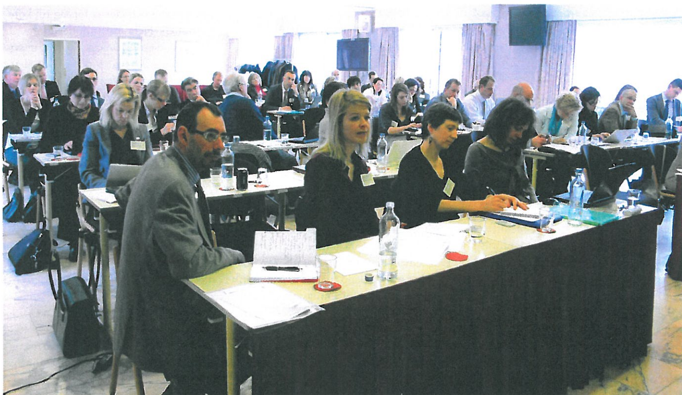
FIGUR 2. Ett stormöte med styrelsen och ledarna för de olika delprojekten hölls i Bryssel i början av året. Här ses Advisory Board.

Delprojekt 1 (WP1) granskar samordning och ledning av hela pilotprojektet. En rådgivande styrelsegrupp tar emot synpunkter/åsikter från myndigheter och andra intressenter och förankrar olika frågor med dessa. Gruppen har till uppgift att fortlöpande informera de olika organisationerna om våra framsteg och resultat. Ledningen består av koordinatören och delprojektledarna. Arbetsinsatserna bygger i stora delar på ett befintligt nätverk av forskare som på ett