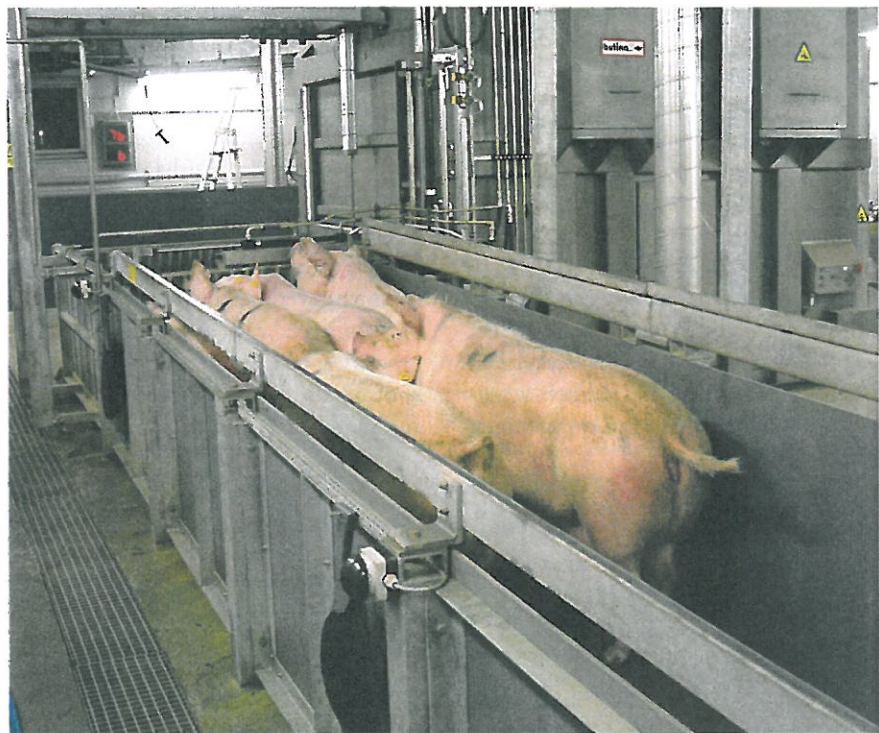
FIGUR 1. Enligt den nya EU-förordningen ska de företag som är involverade i slakt eller avlivning av djur följa ett standardförfarande för att upprätthålla god djurvälstånd.

Av förordningen framgår att de företag som är involverade i slakt eller avlivning av djur för produktion av kött eller päls ska följa ett standardförfarande för att upprätthålla god djurvälstånd (Figur 1). De ska kunna utvärdera effektiviteten vid olika bedövningsmetoder, bland annat genom att kontrollera att bedöva de djur inte återfår medvetandet innan avblodning. Tillverkare av bedövningsutrustning ska bifoga instruktioner om användning, skötsel och effektutvärde-