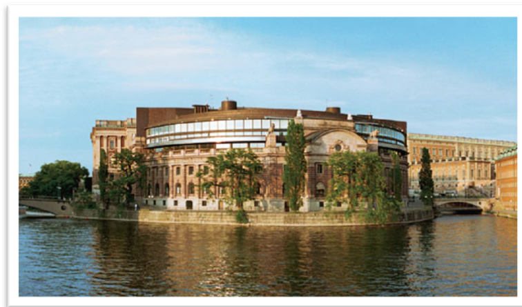
Sveriges riksdagshus.