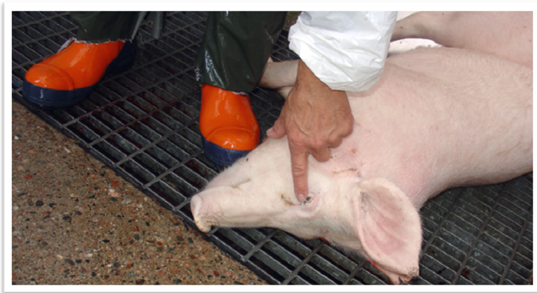
Del av avlivningskontroll på gris. Även bedövningskvalitet kan kontrolleras på motsvarande sätt.

Dålig avblodning ger kortare hållbarhet och sämre köttkvalitet.