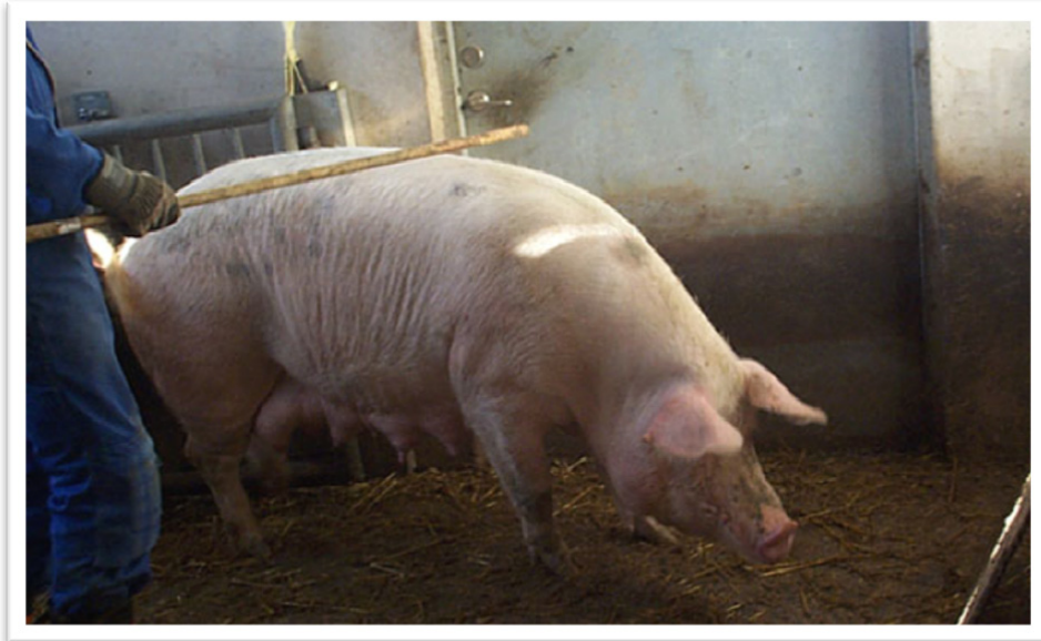
Suggan på bilden är troligen relativt van vid hantering, men kan ändå reagera på nya människor och miljöer.

Livsmedelsverkets officiella veterinär är skyldig att anmäla återkommande brister och problem till länsstyrelsen. Allvarliga händelser ska anmälas omedelbart.