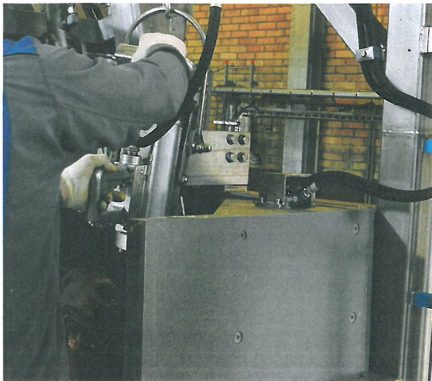
FIGUR 2. EUs förordning om djurskydd vid avlivning ställer krav på vetenskapligt stöd i frågor som rör djurskydd vid slakt, inte minst i samband med bedövning.

DISA tar exempelvis upp vad som sker när djur utsätts för hantering i högt tempo med åtföljande stress, buller och möten med okända artfränder och människor. Utbildningen ger också information om vilka effekter felaktig hantering av djur och redskap får för djurvälståndet och lär ut korrekt djurhantering. SCAW