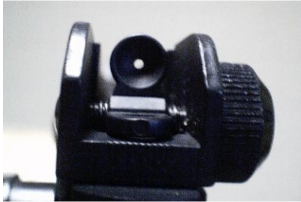
Figur 2. Dioptersikte. Målet lokaliserar i siktets hål och syns som en ljus punkt.

markering på bågsträngen placeras då i linje med bågens sikte och målet ligger i linjens förlängning. Andra sikten kan vara enkla optiska sikten (kikarsikten) med olika grader av förstoring. Dessa sikten kan vara av olika storlek, vikt, konstruktion och ha olika tekniska specifikationer. Ofta används ett optiskt sikte utan förstoring men med belyst mittpunkt, vilken kan ha olika storlek och färg (Figur 3).