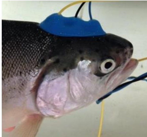
Figur 2. En nyligen utvecklad metod för att mäta EEG på fisk med hjälp av elektroder inrymda i en sugkopp som sugts fast på fiskens huvud.

Behovet att med hjälp av forskning tillhandahålla faktabaserad information om hur de olika bedövningsmetoderna som används för regnbåge och fjällröding påverkar förlusten av medvetande, samt vikten av att detta görs vid alla aktuella temperaturer har påtalats av EFSA (2009c). Därefter har vikten av att frångå användningen av synliga indikatorer på medvetande vid utveckling och verifiering av olika bedövningsmetoder belysts i studier av regnbåge (Bowman et al. , 2019), fjällröding (Gräns et al. , 2016; Sandblom et al. , 2012) och atlantlax (Lambooj et al. , 2010). I litteratursammanställningen har vi trots detta valt att inkludera även studier som endast undersökt visuella tecken på medvetande men vi vill vara tydliga med att dessa metoder endast kan användas för att identifiera huruvida en undersökt metod inte uppfyller kraven på en etiskt försvarbar avlivningsprocedur, inte för att bevisa att en metod faktiskt fungerar.